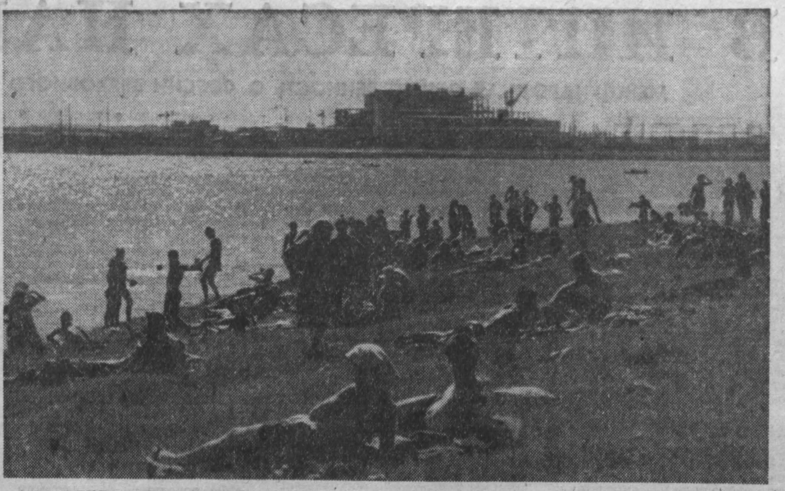
НА БЕЛОВСКОМ МОРЕ.