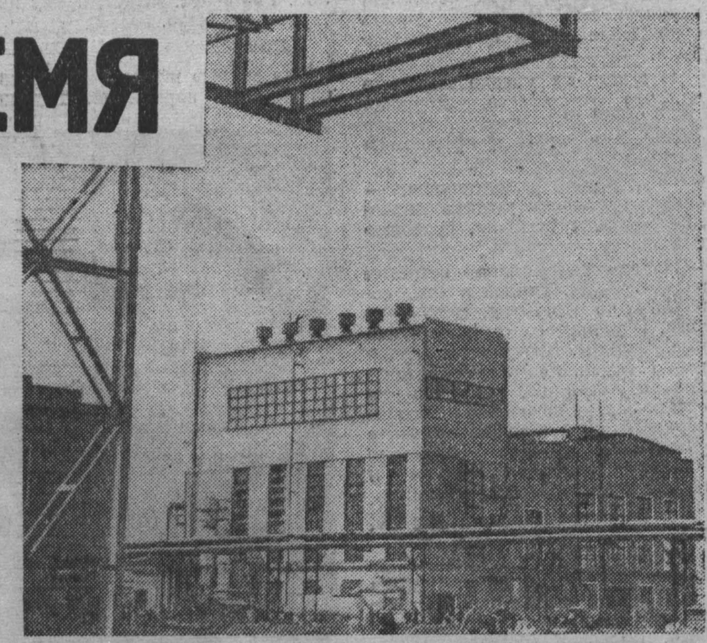
Вот он, главный корпус карбамида! Здесь в огромных колоннах синтеза будет рождаться ценнейшее удобрение...

Сегодня надевает рабочую спецовку КОМПЛЕКС ЦЕХОВ КАРБАМИДА — первый в Сибири и на Дальнем Востоке завод плодородия, рожденный после декабрьского и февральского Пленумов ЦК КПСС.