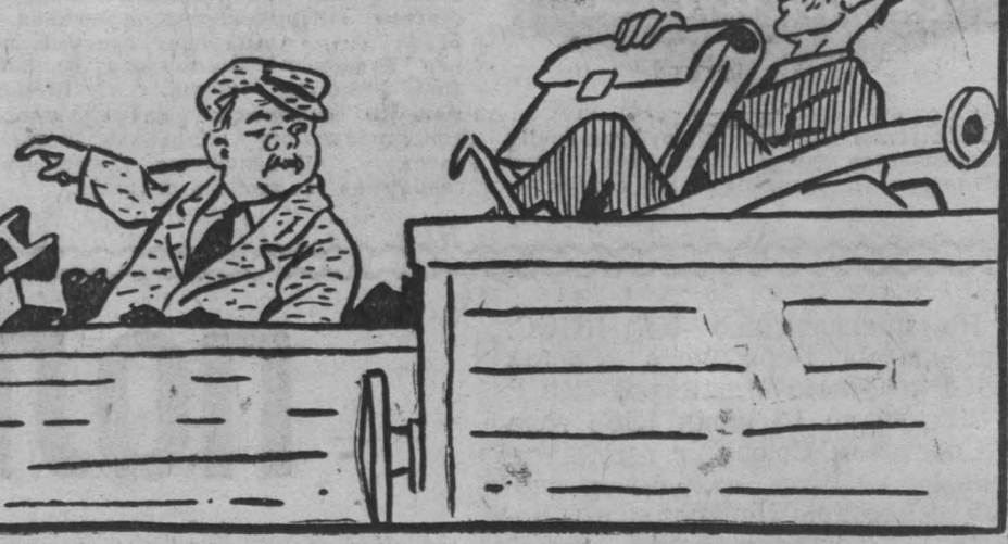
— Куда, братец, сешь металлолом? — На Алтай из Кузбасса... — А я с Алтая в Кузбасс...

Дело здесь не в целесообразности перевозок, а в отсутствии схем межрайонных и внутрирайонных поставок лома. Ведь и в самой Западной Сибири между областными управлениями «Росглавметаллургии» много встречных перевозок. Кемеровчане в 1962-63 гг. поставили предприятиям Алтайского края более трех тысяч и Новосибирской области — более 56 тысяч тонн вторичного металла. В