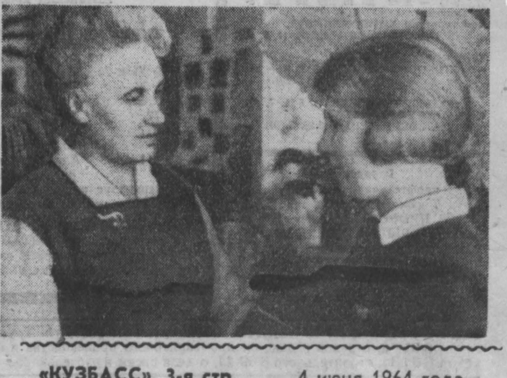
«КУЗБАСС», 3-я стр., 4 июня 1964 года.