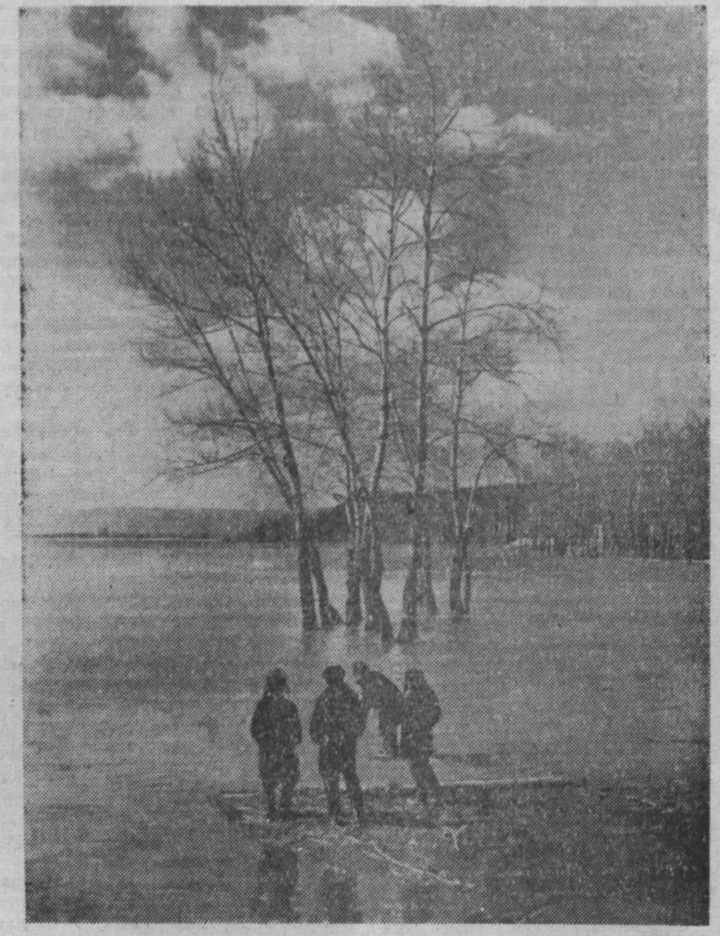
ВЕСЕЛЕННЫЕ ВОДЫ

Свой богатый педагогический опыт мой учитель не держит в секрете, щедро делится им при любом случае. Он посещает наши классные часы и уроки, насколько не стесняя нас своим присутствием, умеет вовремя