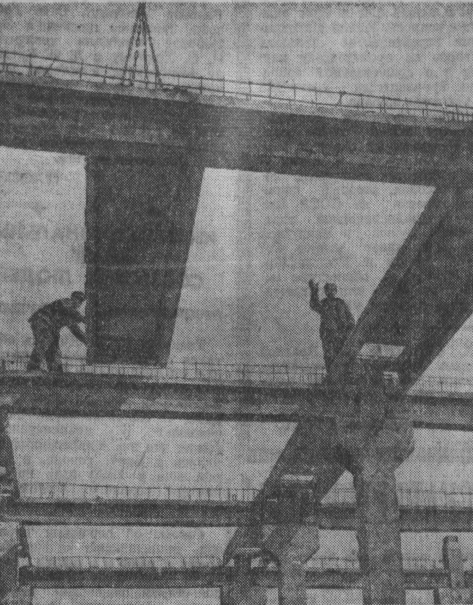
Строится Кемеровский завод синтетического волокна. Монтаж химического корпуса.