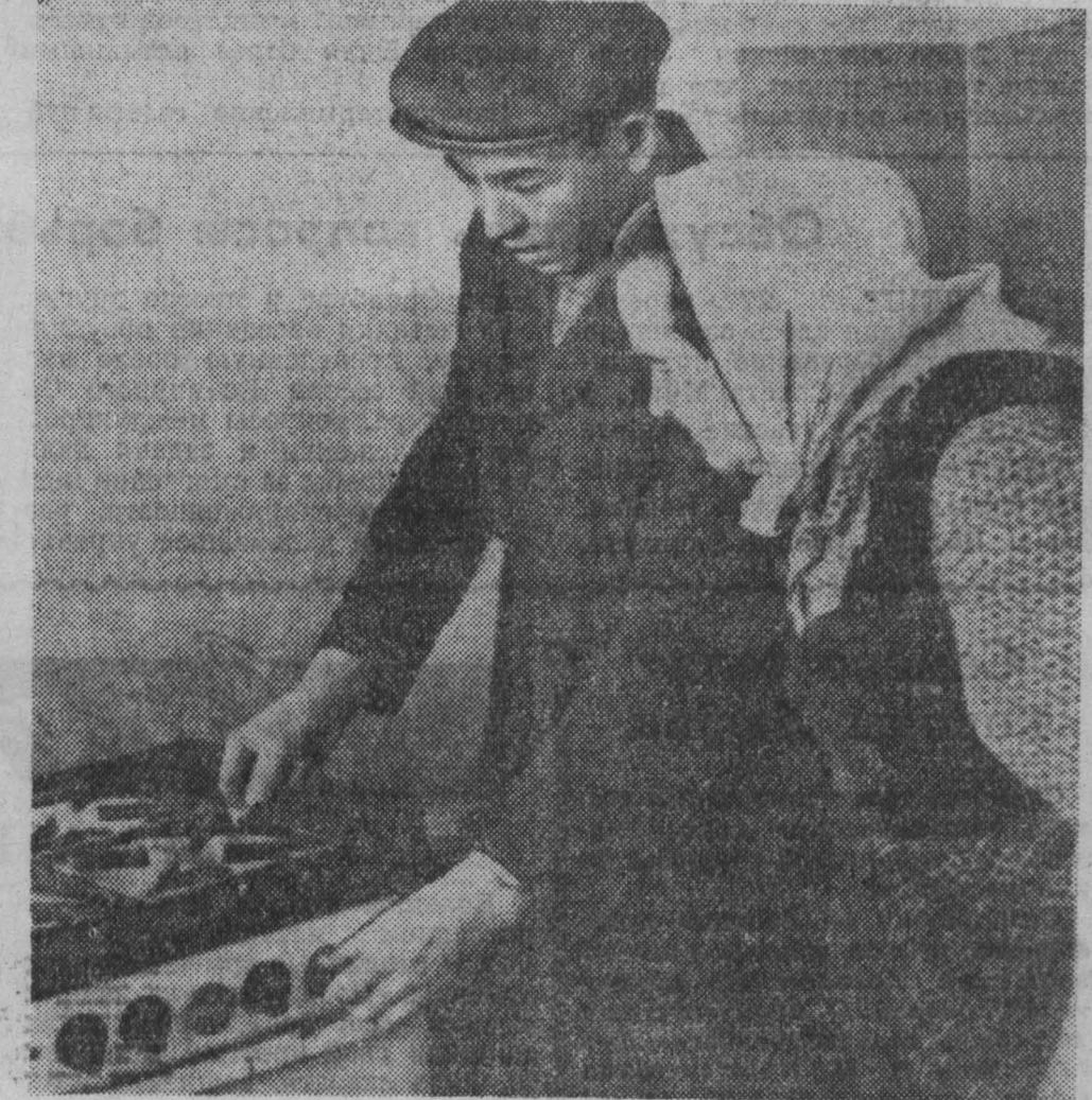
Еще в один дом — Весенняя, 16 — пришел газ.