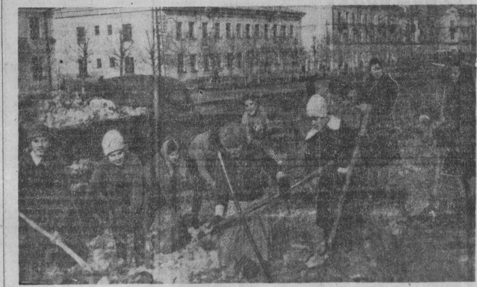
СОБЫТИЯ ПОСЛЕДНИХ ДНЕЙ. Сто тысяч кемеровчан участвовали в первом весеннем массовом воскреснике.

Готовятся к приему овощей, картофеля, фруктов нового урожая хранилища этой продукции. В начале осени они будут способны принять 2.500 тонн картофеля, 415 тонн лука, 150 тонн капусты, 750 тонн фруктов.