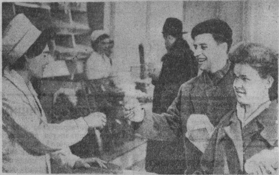
СОБЫТИЯ ПОСЛЕДНИХ ДНЕЙ. На улице П. Лумумбы открылась булочная.

Посмотри вокруг, товарищ. Хорошавет, ширит границы город, в котором мы живем. Это город твой и мой, наш город. Каждый раз, когда в город приходит весна, сессия городского Совета утверждает план развития городского хозяйства на текущий год. Так было и нынче. Депутаты утвердили мероприятия по жилищному, культурно-бытовому, коммунальному строительству на 1964 год, внесли в план основные объекты благоустройства и озеленения. Нам и всегда, в плане нашли отражения просьбы и наказы избирателей областного центра. Нам будет Кемерово завтра? Сегодня мы знакомим кемеровчан с планом строительства и благоустройства города. С планом, выполнение которого зависит от каждого из нас. По примеру прошлых лет нынче решено, что каждый взрослый житель областного центра отдаст 40 часов благоустройству родного города. Сделаем город чистым, светлым, красивым!