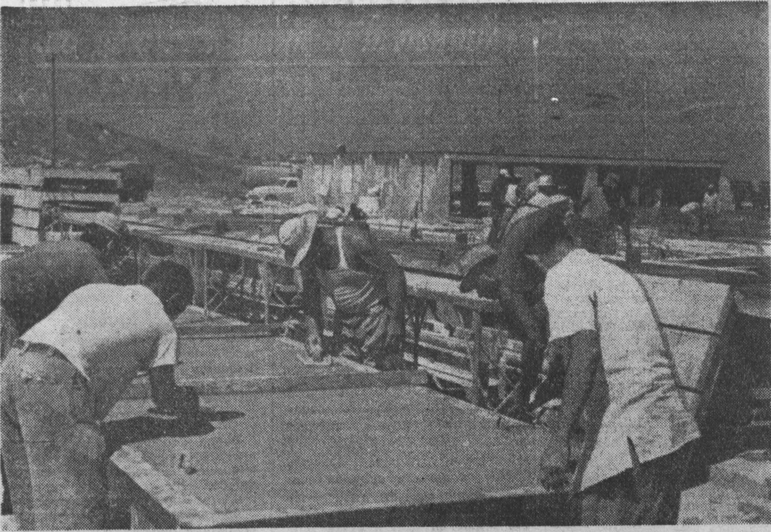
Республика Куба. На западе от Гаваны в провинции Пинар-дель-Рио сооружается самая крупная в республике Марьяльская тепловая электростанция. Она будет снабжать электроэнергией столичные промышленные и сельскохозяйственные предприятия двух провинций.