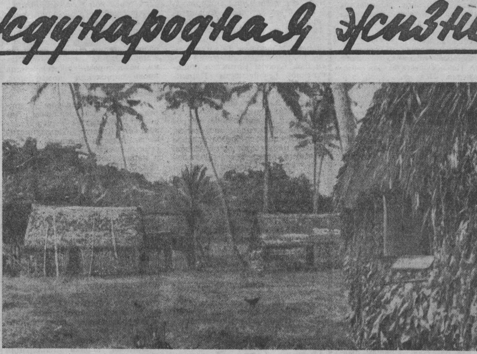
Острова Фиджи — английская колония в южной части Тихого океана. Фиджийская деревня сейчас выглядит как в многие столетия назад: под раскидистыми кронами кокосовых пальм — лачки из бамбука и пальмовых листьев. Вместо пола — циновка из листьев пальм.

Бирманцы сравнивают Ирвалль с Волгой, видимо, не случайно. В этом выражается искреннее стремление к дружбе с Советским Союзом. Эта дружба нашла свое