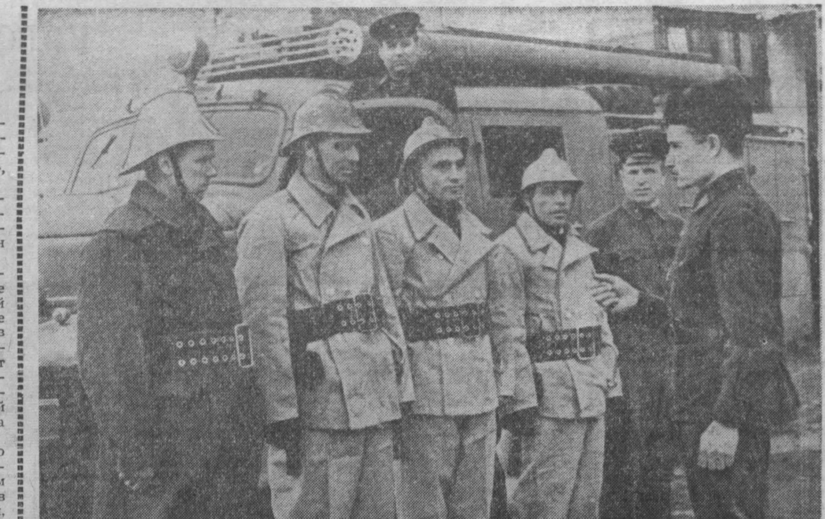
17 апреля 1918 года В. И. Ленин подписал декрет о создании советской пожарной охраны. Блестяще несут службу бойцы Ленинск-Кузнецкого гарнизона. В тесном взаимодействии с дружинными добровольцами они ведут большую профилактическую работу по предотвращению пожаров.