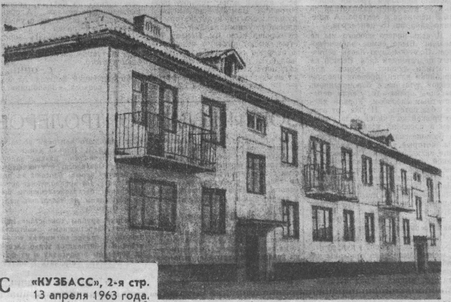
«КУЗБАСС», 2-я стр. 13 апреля 1963 года.