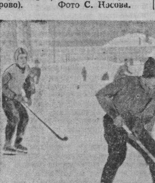
Хоккей с мячом класса «А» на кубок Сибиря. На снимке: момент игры между командами «Металлист» (Красноярск) и «Химик» (Кемерово).