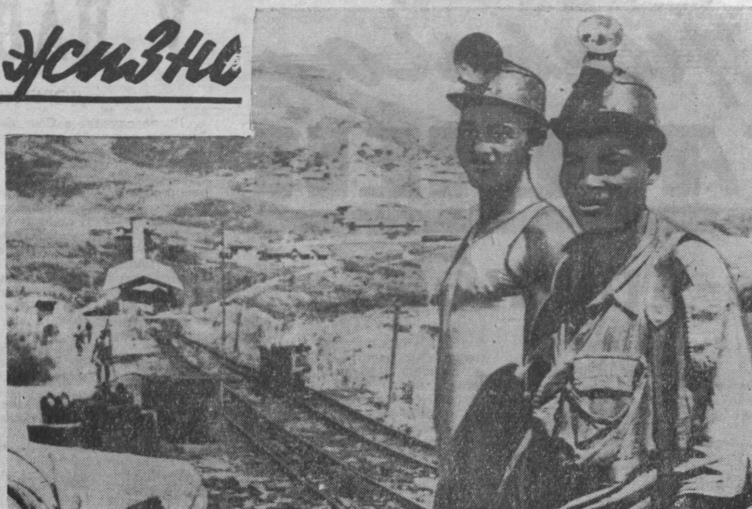
В Нигерии имеются крупные месторождения каменного угля и различных руд.

Эти ядовитые вещества, горющие в письме, были рассеяны Соединенными Штатами.