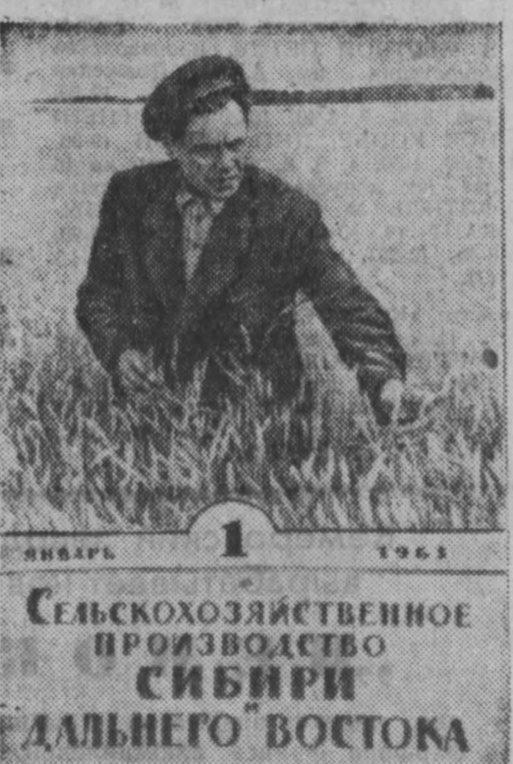
СЕЛЬСКОХОЗЯЙСТВЕННОЕ ПРОИЗВОДСТВО СИБИРИ ДАЛЬНОГО ВОСТОКА

Большой интерес для хлебороба представляет также статья профессора Курганского сельскохозяйственного института Н. В. Бутяева «Что дает интенсивная система земледелия». Механизаторам полезно прочесть статью «Передовые приемы