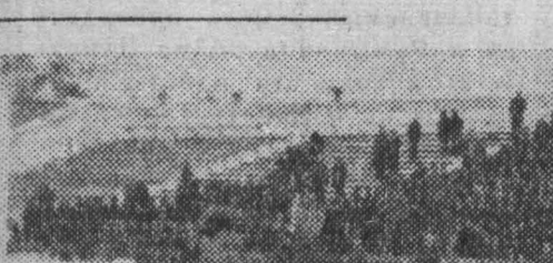
Товарищеская встреча хоккеистов Кемерово и Хабаровска.