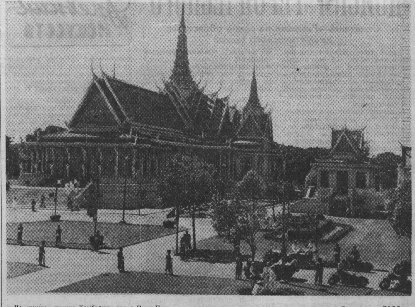
На снимке: столица Камбоджи город Пном-Пень.

Председатель «совета генералов» в своем обращении к населению объявил армию хозяином положения в городе и призвал народ к соблюдению порядка. Из Сайгона также сообщают, что «совет генералов» потребовал от Нго Динь Дьема распустил правительство и национальный совет, а самому отречься от власти и покинуть пределы страны, и что последний будто бы принял этот ультиматум.