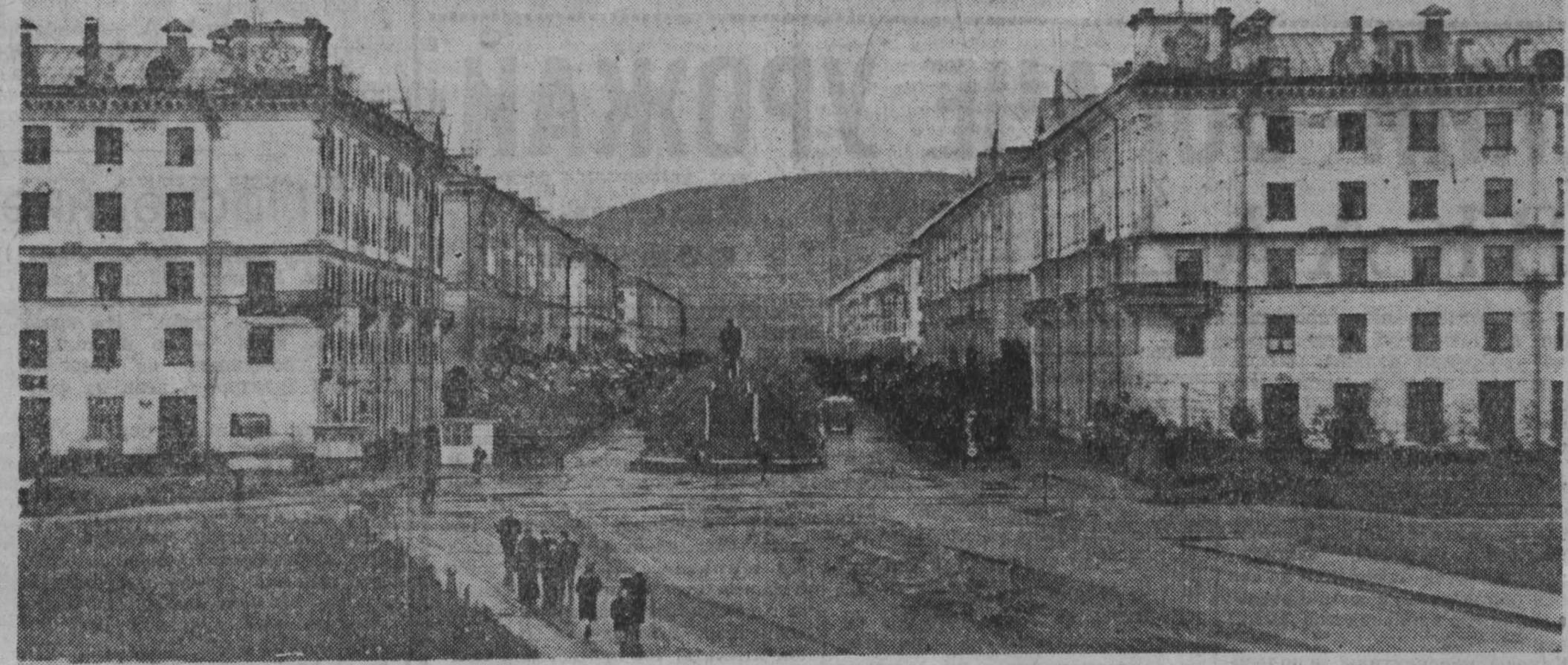
РАСТЕТ НОВЫЙ ШАХТЕРСКИЙ ГОРОД МЕЖДУРЕЧЕНСК. На снимке: Коммунистический проспект.