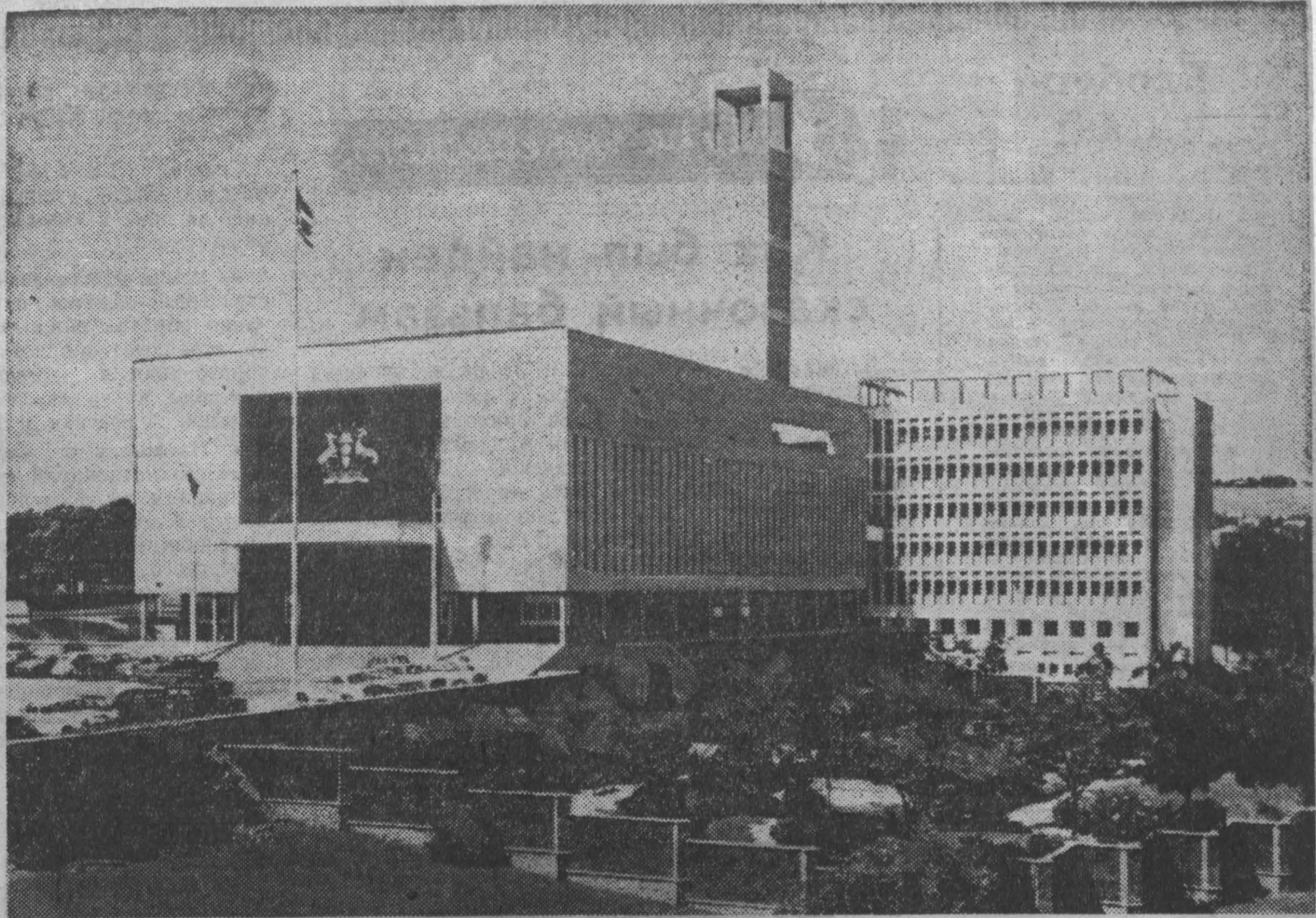
9 октября в Угаде отмечался День провозглашения независимости страны. На снимке: столица государства — Кампала. Здание Национального собрания (парламента).