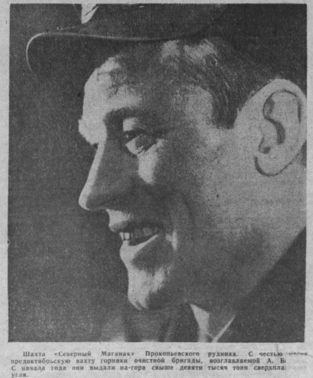
Шахта «Северный Маганак» Прокопьевского рудника. С чеством передовиков шахты горняки очистной бригады, возглавляемой А. Б. С. Напада тогда они вывели на-гора свыше девяти тысяч тонн сверхплана угля.

В заключение вечера участники художественной самодеятельности Дома культуры дали большой концерт.