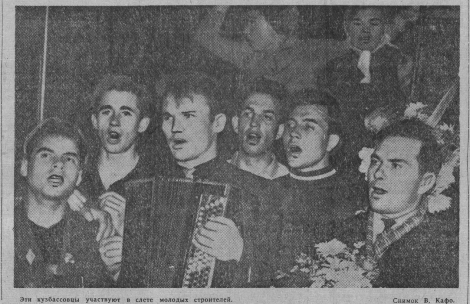
Эти кузбассовцы участвуют в слете молодых строителей.

Скорю по дороге пойдут поезда. — Смотри, какая береза, — говорит мне Володя, показывая в ту сторону, где встанет поселок. — Вот бы хорошо ее оставить, правда? Несколько дней назад он напи-