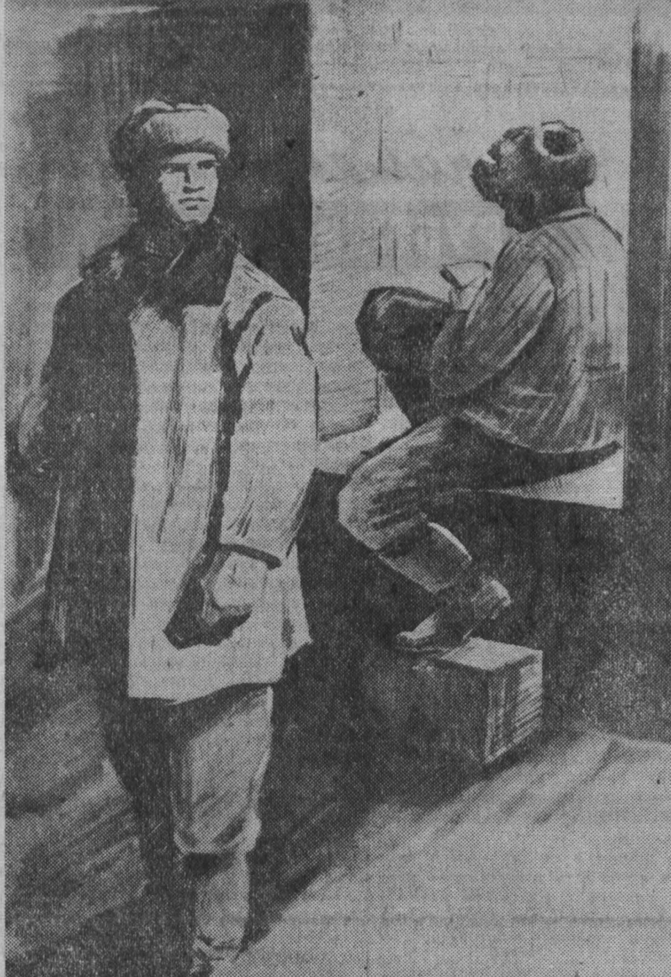
Рис. Е. Смирнова.

Галочкин подошел тихо, стал боком. Как будто остановился мимоходом. Сказал тоже, как было делом, глядя на стенку. — О чем другом, — так он говорил потому, что не знал, точно, из-за чего пришел сюда главный — из-за комнаты для брнза или из-за своего кабинета, — начальство, конечно, беспокоится... А тут что? Ты стеники ложись, а перегородки стави дядя. Да еще кран у тебя отбрает. А что я их — вечером не мог бы поставить? Главный оторвался от блокнота, смотрел на Галочкина. — Речь готовишь? — Зачем? Уже говорю... — А-а, ну давай, давай, — протянул главный, — А я пошел. Он легко поднялся с подоконника и пошел к выходу, и Галочкин растерянно бросил ему вслед. — Во-во, и пошел сразу... — Так ты это мне говорил, что ли? — обернулся главный. — А кому ж еще?.. — Во-он какое дело, — удивился инженер. — А я смотрю — мужична к стенке отвернула и бунбит что-то. Мешать, думаю, не стоит. Так в чем дело?.. Галочкин повторил все насчет монтажа. — Девочку одну заставляло работать, а она говорит: единственное платье. Замарало, в чем ходить буду?..