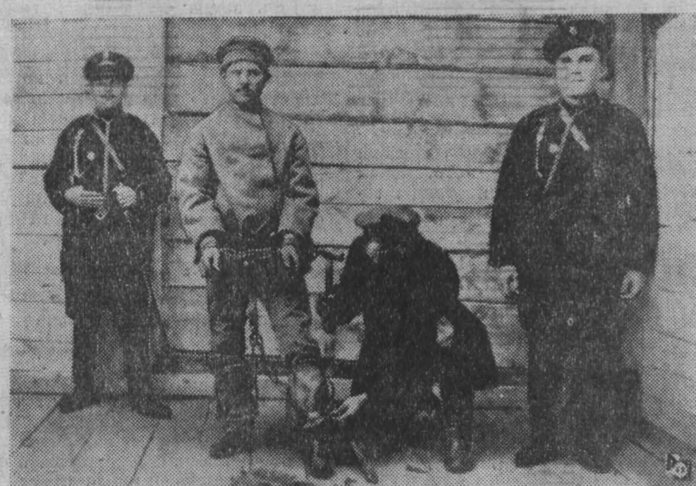
Дорога страданий, по которой царь гнал в далекую ссылку каторжан... В одной из пересыльных тюрем на Сахалине.