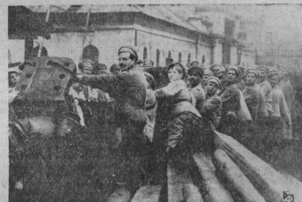
Рабочие Верхне-Ижевского завода города Свердловска на коммунистическом субботнике.