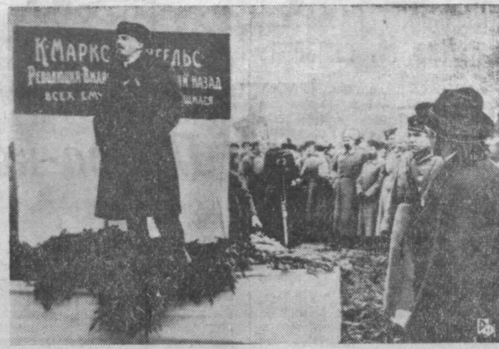
Владимир Ильич Ленин 7 ноября 1918 года на открытии памятника Марксу — Энгельсу.