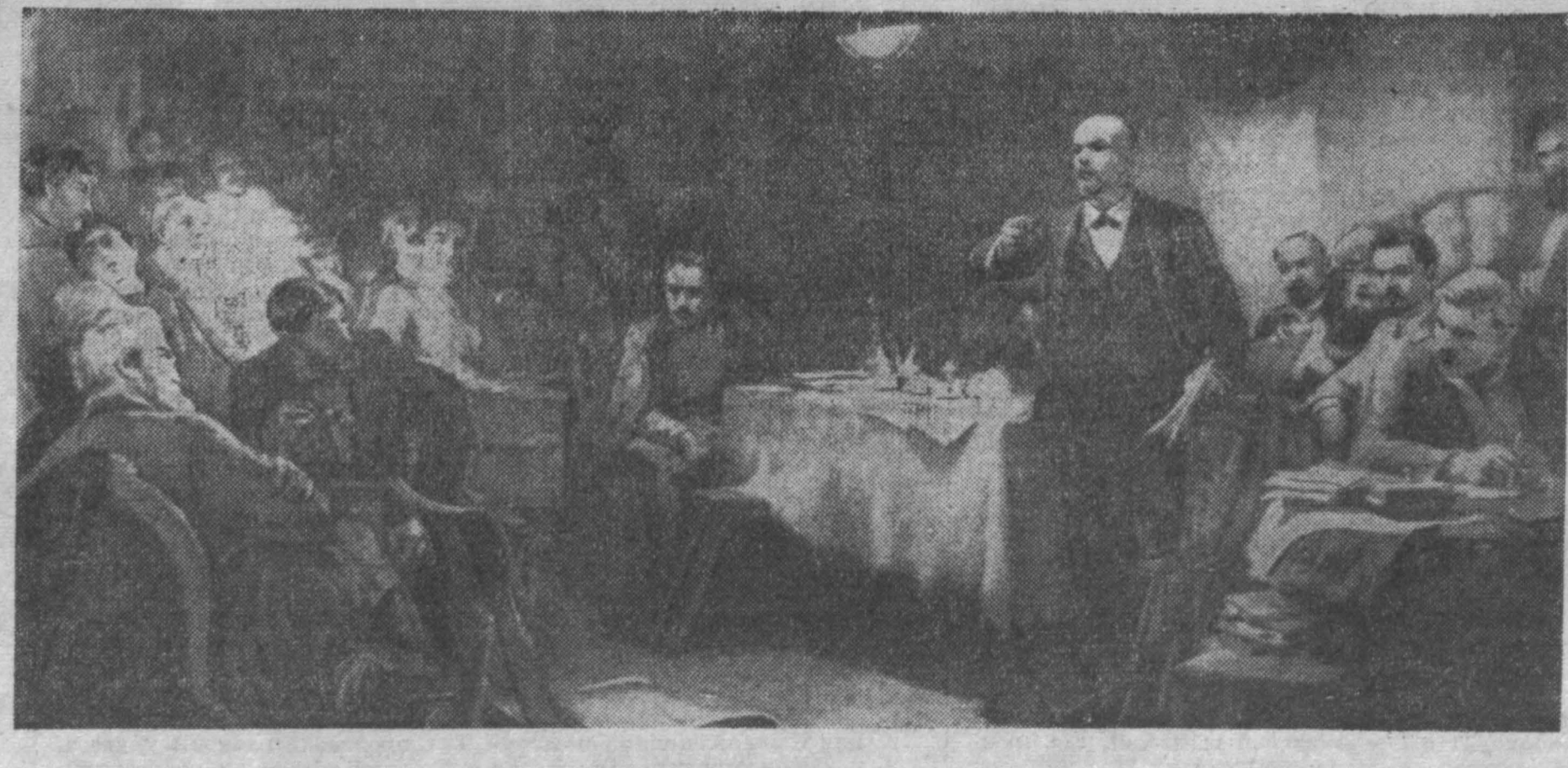
Выступление В. И. Ленина на II съезде РСДРП.