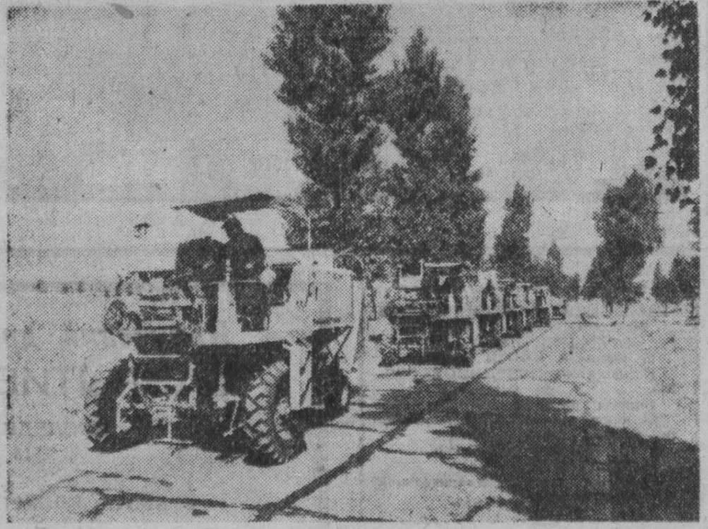
С каждым годом кооперативы и государственные хозяйства Венгерской Народной Республики получают все больше сельскохозяйственной техники: тракторов, комбайнов. Вот и эти самоходные комбайны направляются в кооперативы.