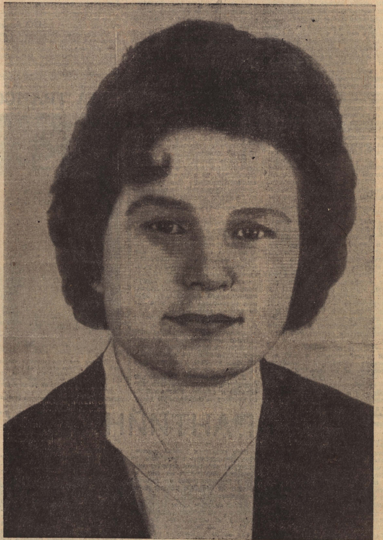
Космонавт Валентина Владимировна ТЕРЕШКОВА

В течение прошедших суток космонавты, помимо научных исследований, вели между собой двухстороннюю радиосвязь. Связь между кораблями надежная. Все бортовые системы работают нормально.