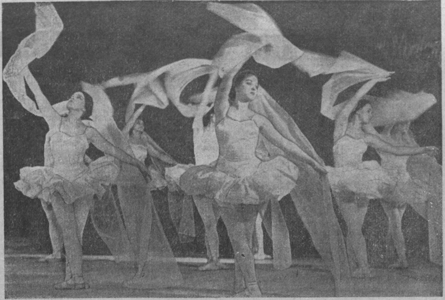
Большой популярностью пользуется в городе металлургов, строителей и шахтеров Новокузнецкий народный театр балета. На снимке вы видите сцену из балета Л. Миньуса «Вальдерка».

На базе БелАЗ-540 создано целое семейство большегрузных автомобилей. Закончились заводские испытания автопоезда БелАЗ-540. Его грузоподъемность 45 тонн. Сейчас изготавливаются образцы этой машины для работы в рудных карьерах. Проходит заводские испытания 40-тонный самосвал БелАЗ-548. А в экспериментальном цехе завершается изготовление еще одной новинки жодинских машиностроителей — автопоезда грузоподъемностью 65 тонн.