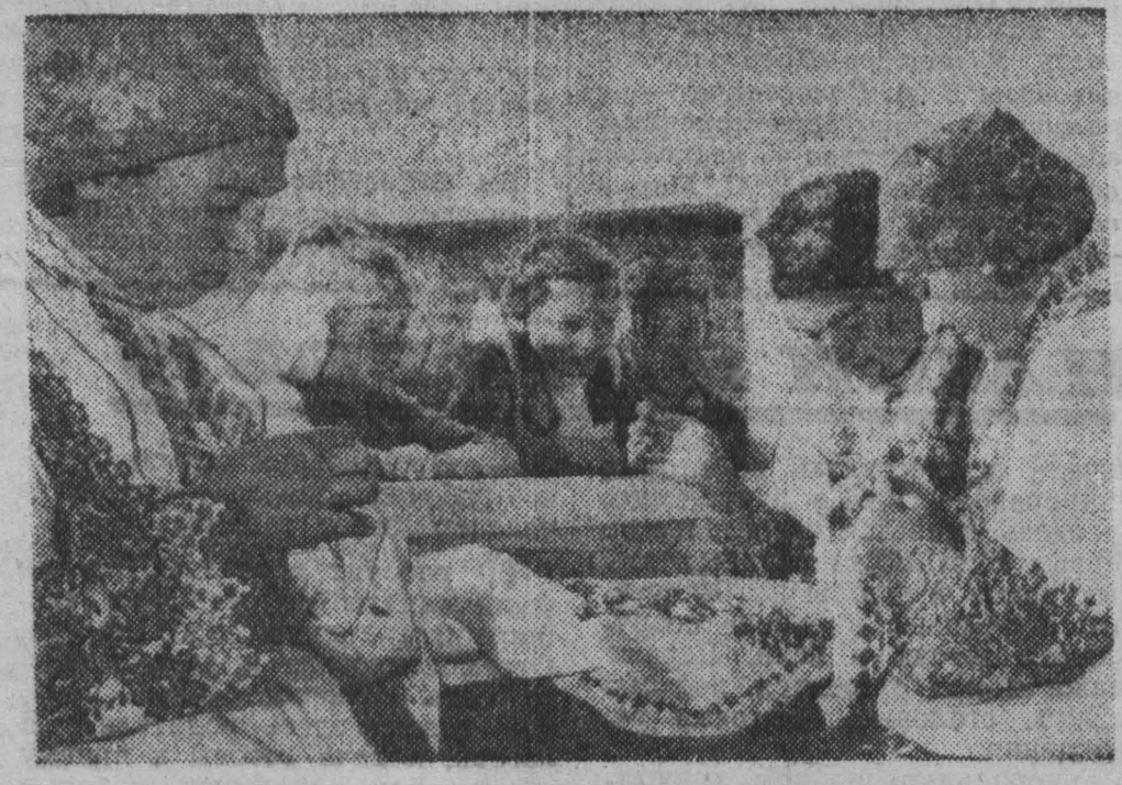
Венгрия. Славящиеся мастерством руководящие работники Шаогаара готовят в подарок Всемирному конгрессу жемчужные платки, расшитые национальными узорами. В июне его примет в Мюльбах члены венгерской делегации.

ЛОНДОН, 12 июня. (ТАСС). Президиум Всемирного Совета Мира решил учредить премию мира имени Ламбракиса. Об этом сообщается в опубликованном вчера в Лондоне заявлении президиума. Это решение, принятое в одном из залов Боннского дворца, было принято, чтобы почтить память великого и хорошего человека. Его убийство после мирного митинга в Салониках является отражением той борьбы, которая сегодня идет во всем мире между все большими и все растущими силами, выступающими за разрушение и мир, демократию и равенство людей, и небольшим, но все еще влиятельным меньшинством, которое готово пожертвовать цивилизацией ради того, чтобы помешать продвижению человечества к процветанию и счастью в мире без войн. Ламбракис был человеком огромной энергии, смелости и человечности, которые он безраздельно посвятил делу мира во всем мире. Его трагическая смерть — непоправимая утрата для германского и многострадального греческого народа. В заявлении указывается, что премия мира имени Ламбракиса будет выдаваться в форме серебряной медали с его изображением и именем на лицевой стороне и с изображением голубя Пикассо и надписью: «Всемирный Совет Мира» — на оборотной стороне. Ею ежегодно 27 мая, в годовщину его смерти, будут награждаться те 50 борцов за мир, которые, по мнению Президиума ВСМ, лучше всего служили делу мира и разоружения в данном году. Премия будет выдаваться вместе с именным дипломом.