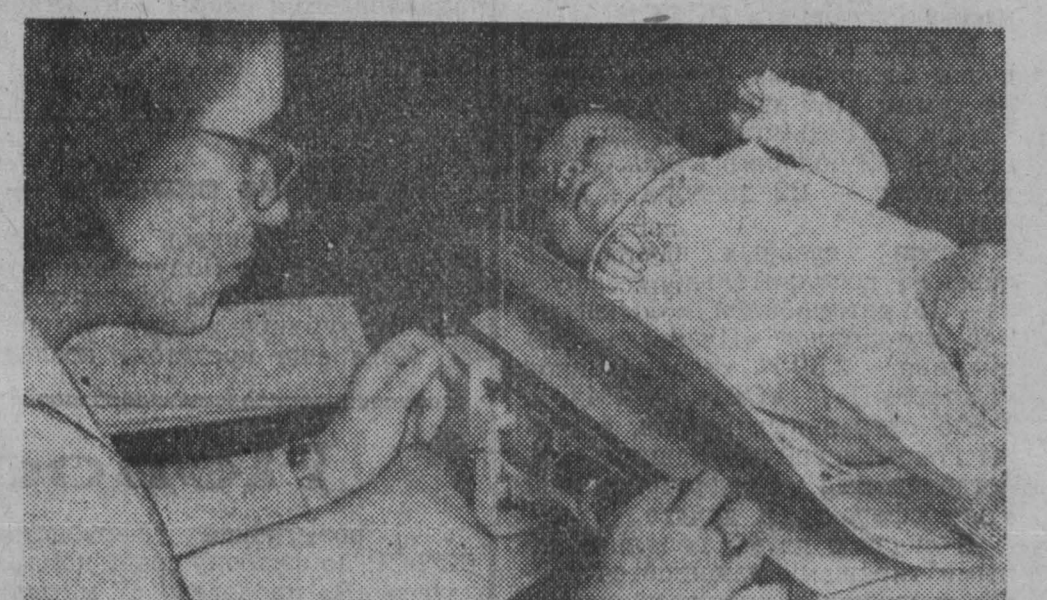
Большим вниманием окружено в Германской Демократической Республике новое поколение будущих строителей социализма. Ежегодно правительство ассигнует сотни миллионов марок на охрану материнства и младенчества. На эти средства строятся новые детские учреждения, создаются все необходимые условия для нормального развития детей. Немецкие врачи ведут активную борьбу за повышение рождаемости в стране. Понятно, что в первую очередь внимание уделяется женщинам, в браке которых нет детей или рождение которых произошло в неблагоприятных условиях. Заглянем в одну из детских консультаций, которая находится в берлинском районе Панков. Население этой части города ежегодно увеличивается на 2.000 человек. Каждой маме известно дом на улице Готтштрассе. Ребенок состоит здесь на учете со дня рождения до 3-летнего возраста. Квалифицированные специалисты консультируют молодых женщин по вопросам правильной заботы за детьми, проводят профилактические осмотры малышей, делают прививки, предохраняющие от болезней. Все виды медицинской помощи оказываются бесплатно. На снимке: «Сколько ты прибавил в весе за это время?»