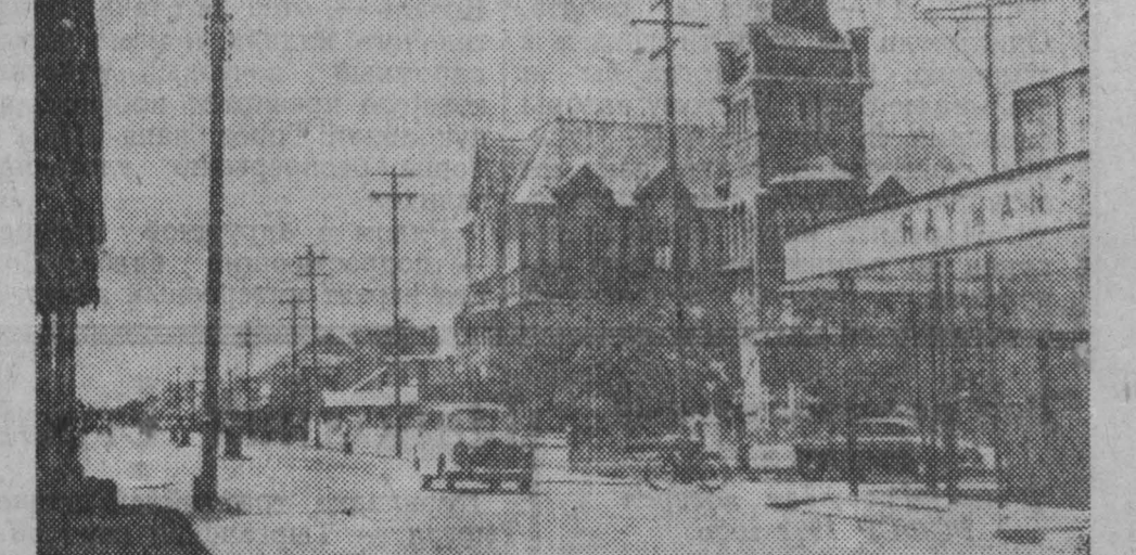
Британская Гвиана — колония Великобритании на Атлантическом побережье Южной Америки. На снимке: главная улица Джорджтауна.