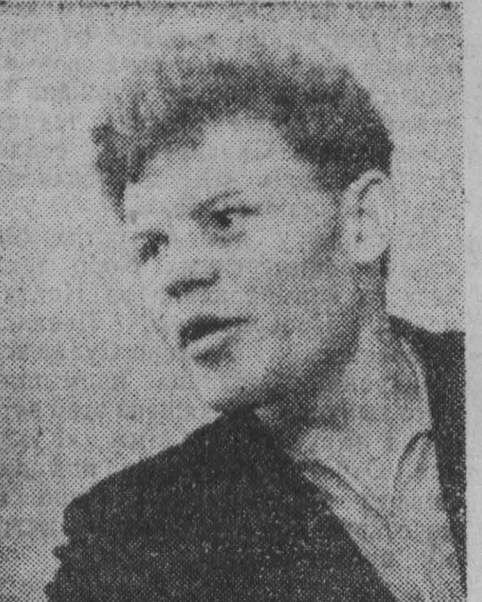
П. СМЕРДОВ: Газосварщики работают на совесть. Но, разумеется, резервов и у нас немало.