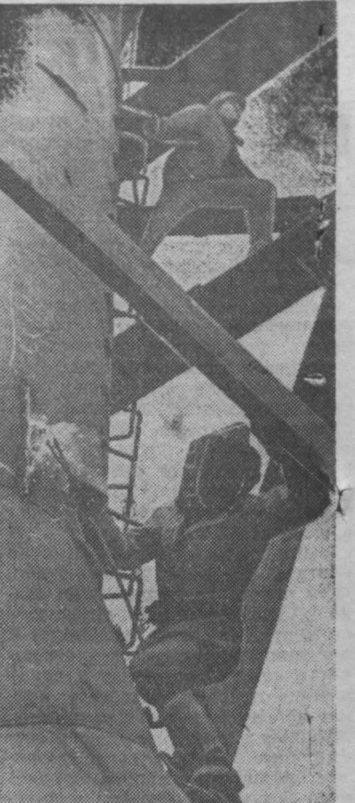
С каждым днем пириятся фронт работ на строительстве нового цеха черной металлургии — Западно-Сибирского завода. Патриоты, со всех концов страны приехавшие на ударную стройку семилетки, сооружают коксую батарею и доменную печь, строят электростанцию и новые жилые корпуса. На снимке вы видите монтаж металлоконструкций.