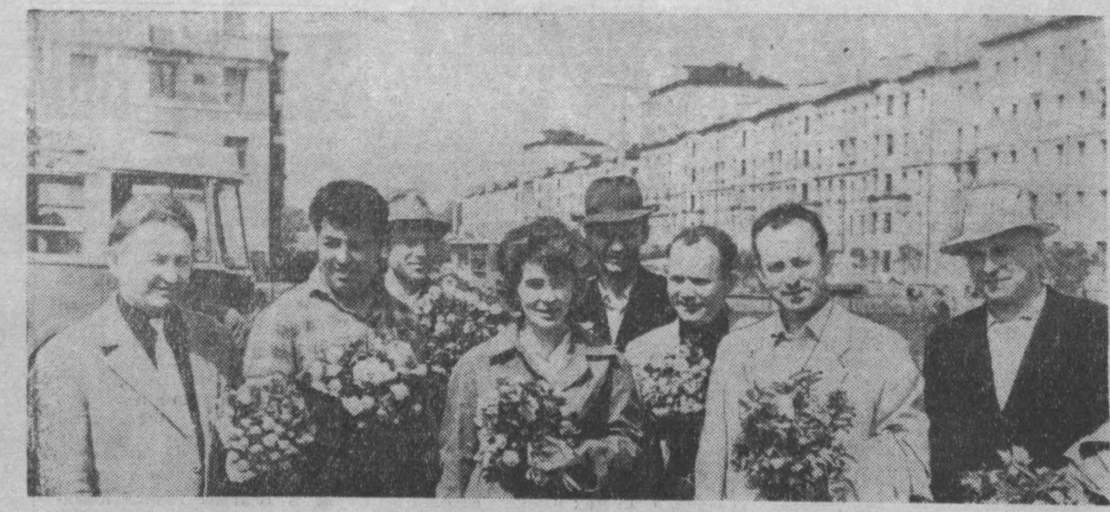
В городах Кузбасса начался большой музыкальный фестиваль. НА СНИМКЕ: группа артистов Государственного русского народного оркестра имени Осипова, который только что прибыл на гастроли в Новокузнецк.