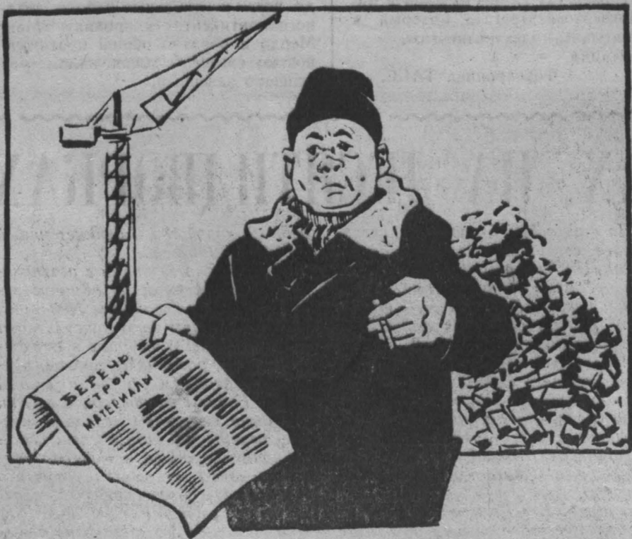
— Олять за экономией? Я же этим в прошлом году занимался!

Многие мастера и прорабы равнодушно относятся к бригадному хозрасчету, к экономии материалов.