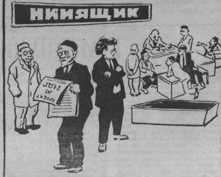
Не создать ли нам такой научно-исследовательский институт?