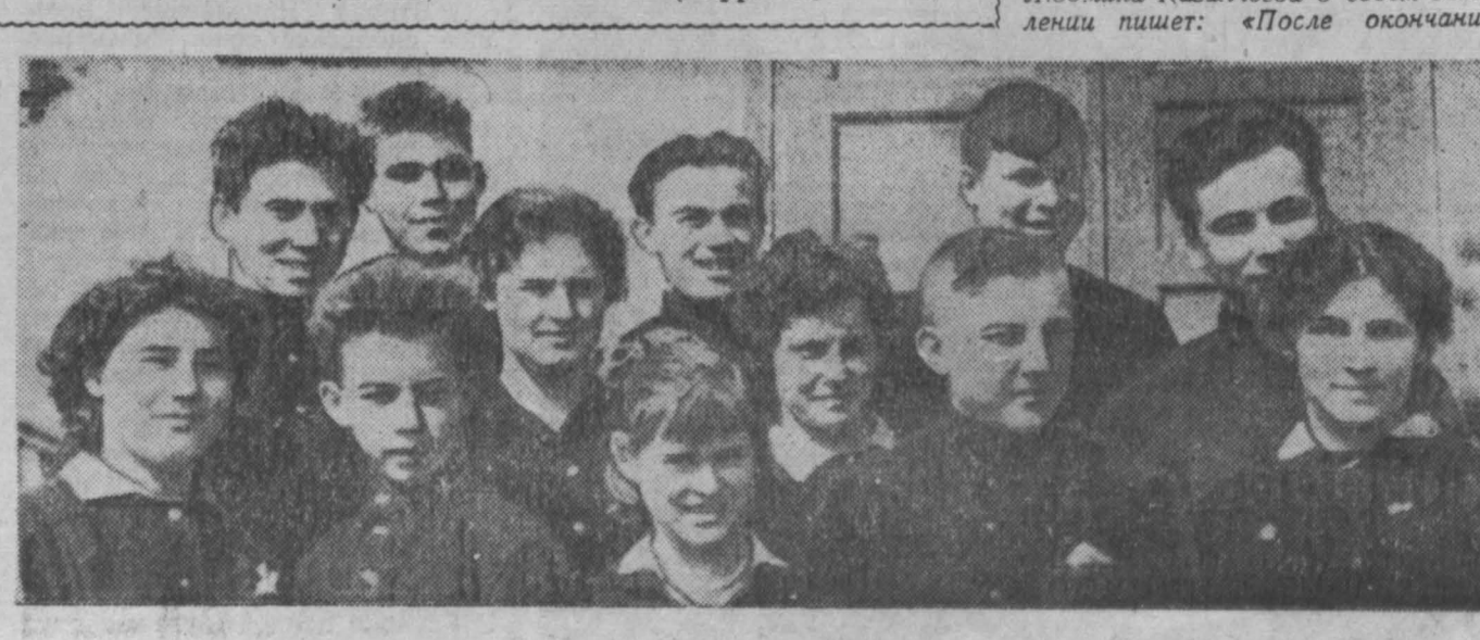
НА СНИМКЕ: группа учащихся строительного училища, извещающая желающих поехать на работу в село.