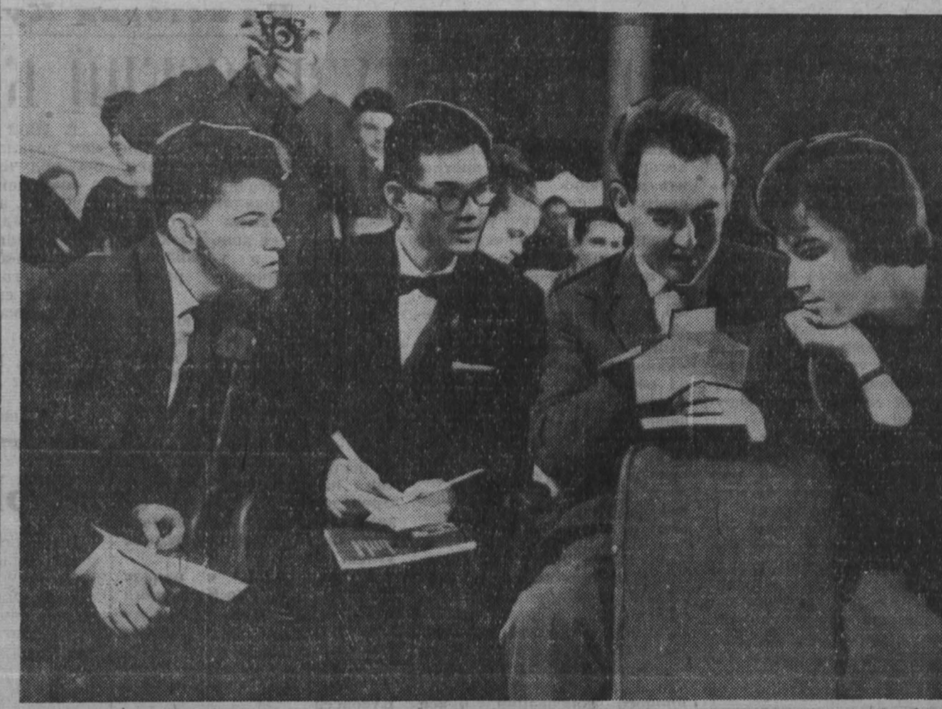
МОСКВА. Второй Международный конкурс пианистов, скрипачей и виолончелистов имени П. И. Чайковского.