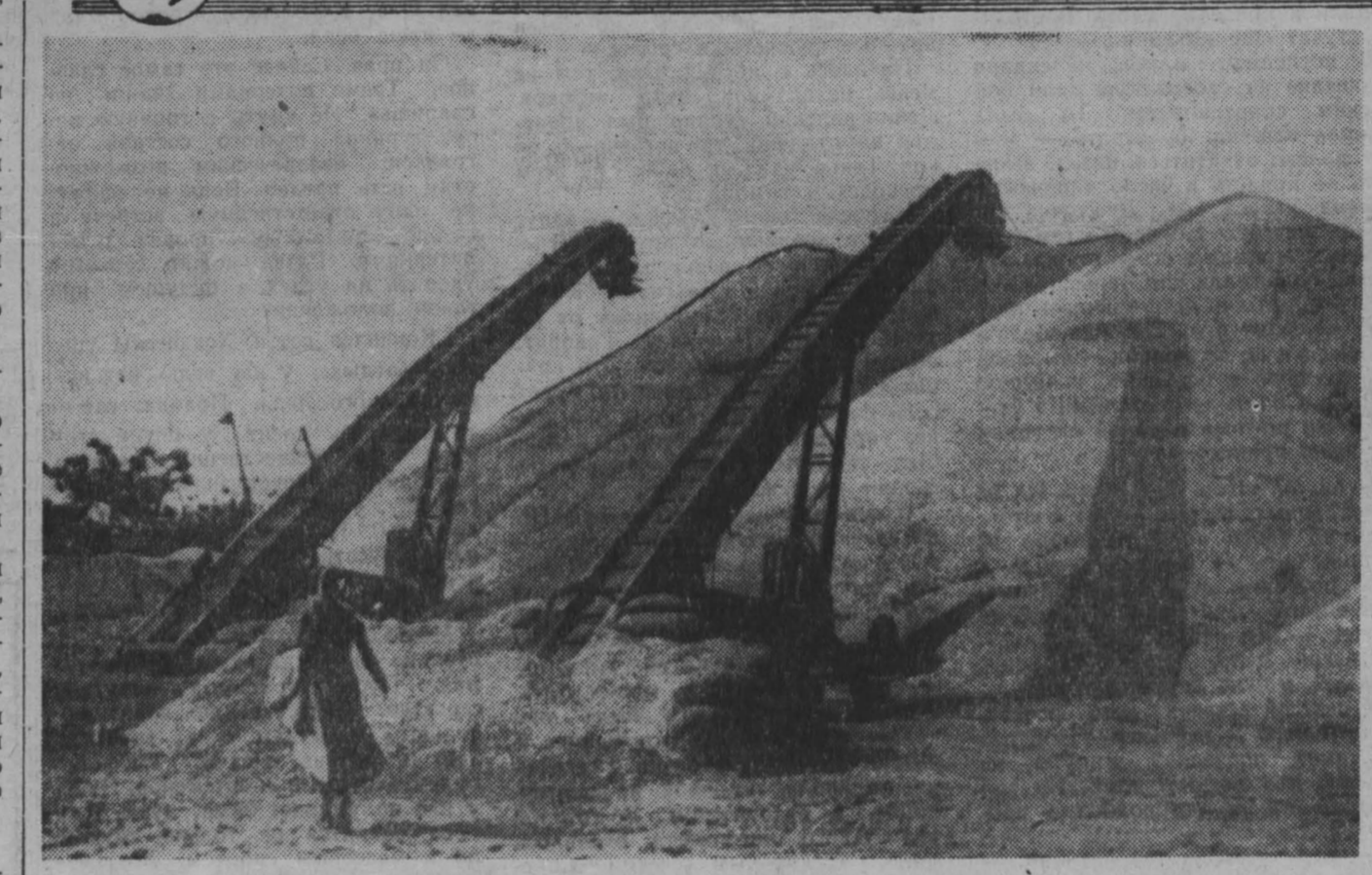
Важнейшей сельскохозяйственной культурой в Республике Сенегал является земляной орех. По его производству (около 900.000 тонн в год) страна занимает четвертое место в мире, 80 процентов этого продукта идет на экспорт.