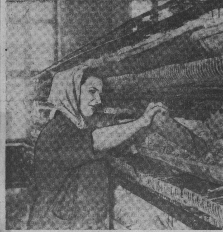
Коллектив Арлюкской птицефабрики более чем на месяц раньше срока завершила квартальный план по сдаче мяса государству.