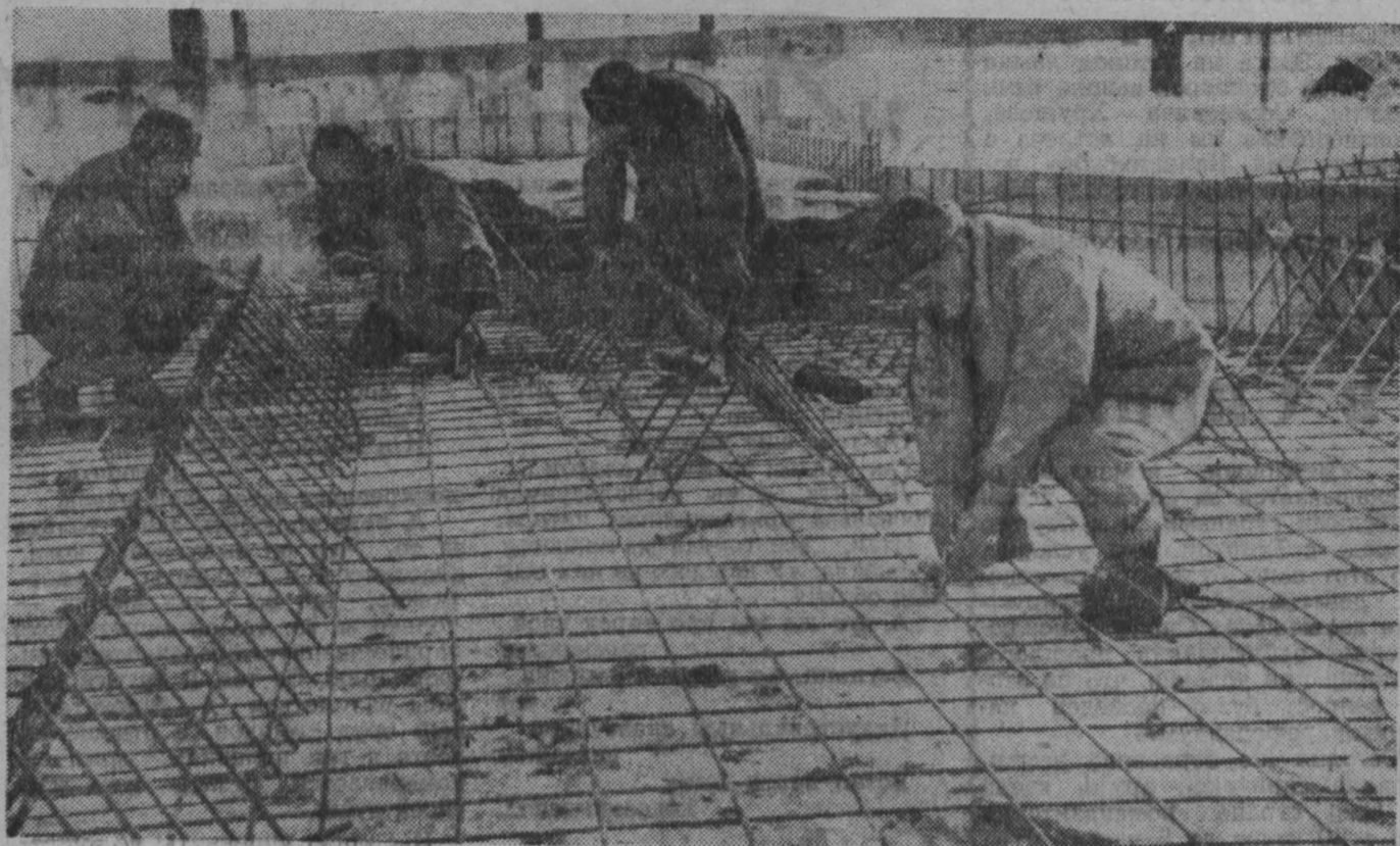
Полным ходом идут работы на строительстве теплоэлектроцентрали Залесца. На сооружении водоподъема только в дайбу и ее откосы будет вложено более 4500 кубометров сборного и монолитного железобетона.

НА СНИМКЕ: вязка арматуры днища выходящего оголовка на головном сооружении станции водоподъема. По нему пойдет вода из напорных труб по каналу на ТЭЦ.