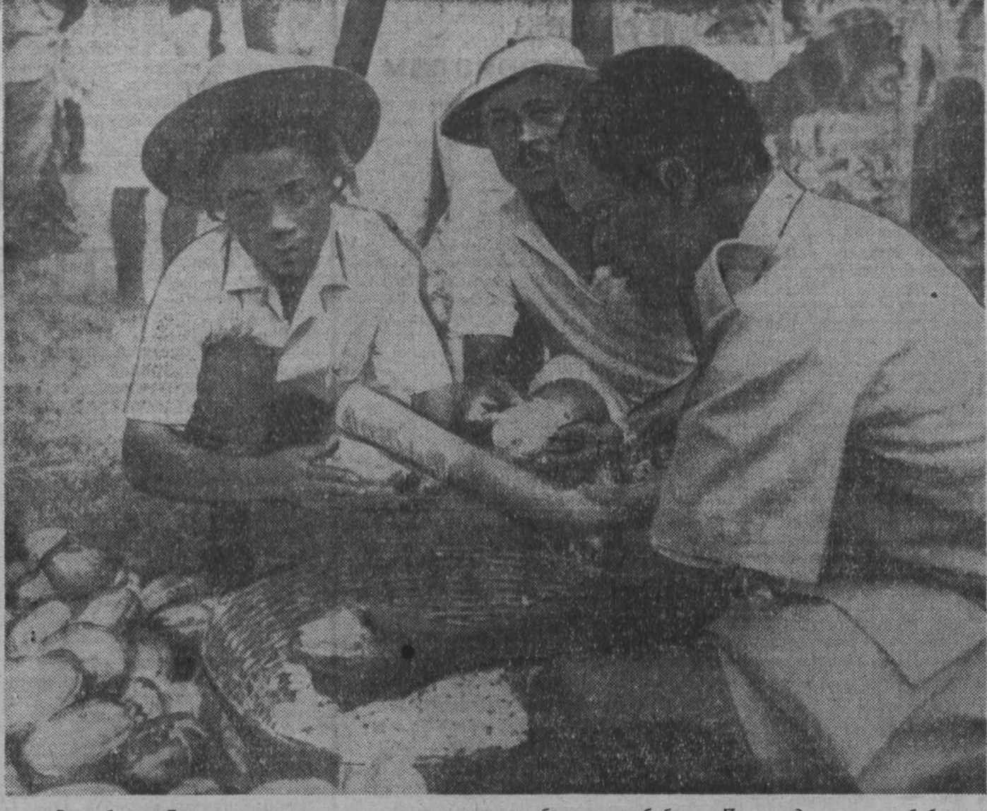
Республика Гана занимает первое место в мире по сбору какао-бобов. Производство какао-бобов сосредоточено в южных и центральных районах Ганы на плантациях...