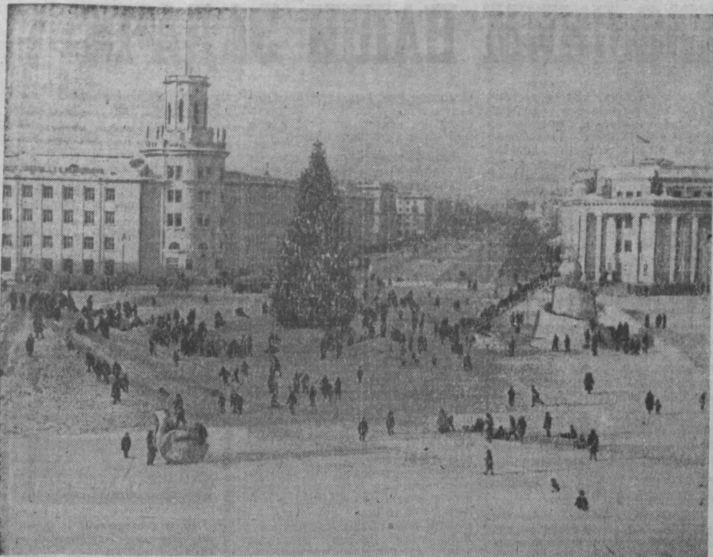
Новогодняя елка на площади Советов в городе Кемерово.