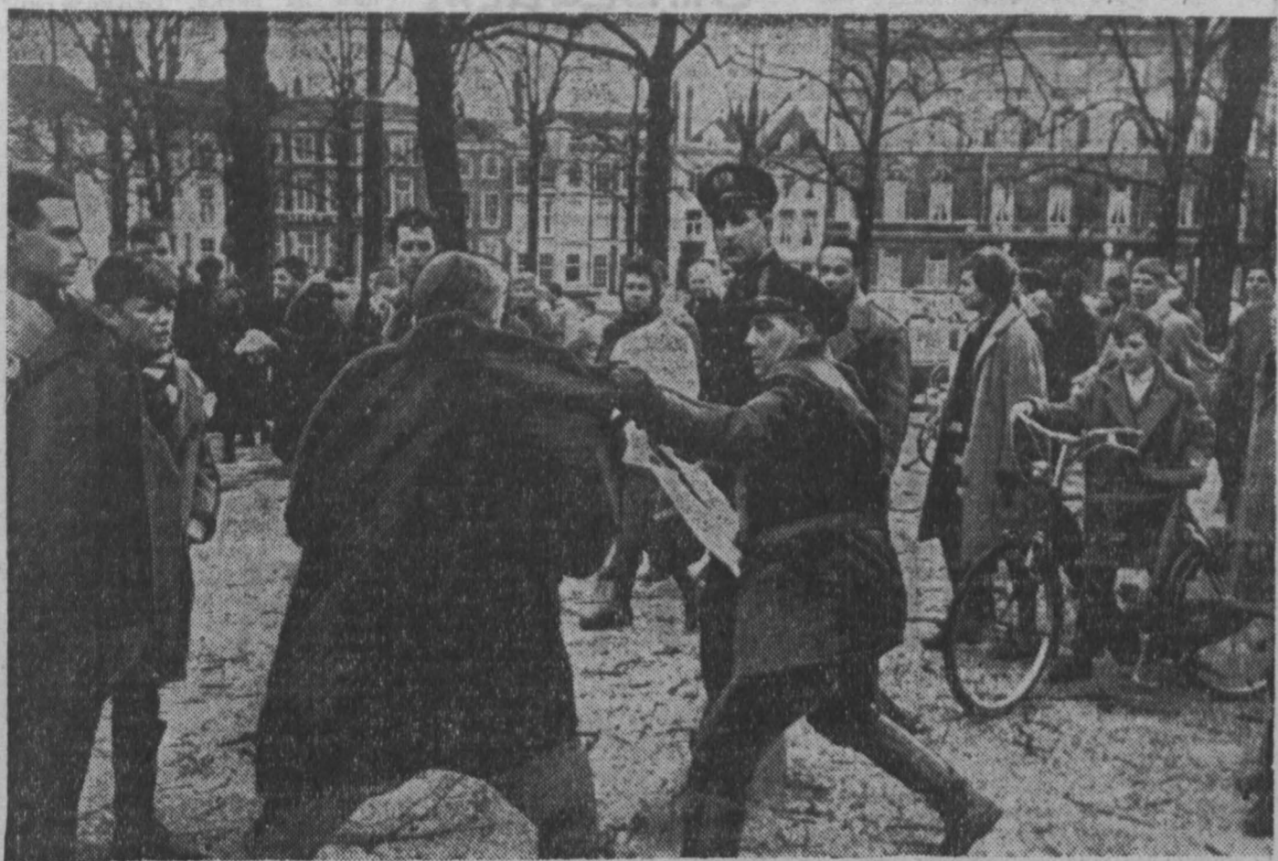
ГОЛЛАНДИЯ. В один из дней второй половины февраля у здания посольства США в Гааге большая группа студентов устроила демонстрацию протеста. Молодежь требовала не посылать голландские войска в Западный Иран, запретить атомную бомбу, покончить с ОАС.

НА СНИМКЕ: полицейский тащит одного из участников демонстрации.