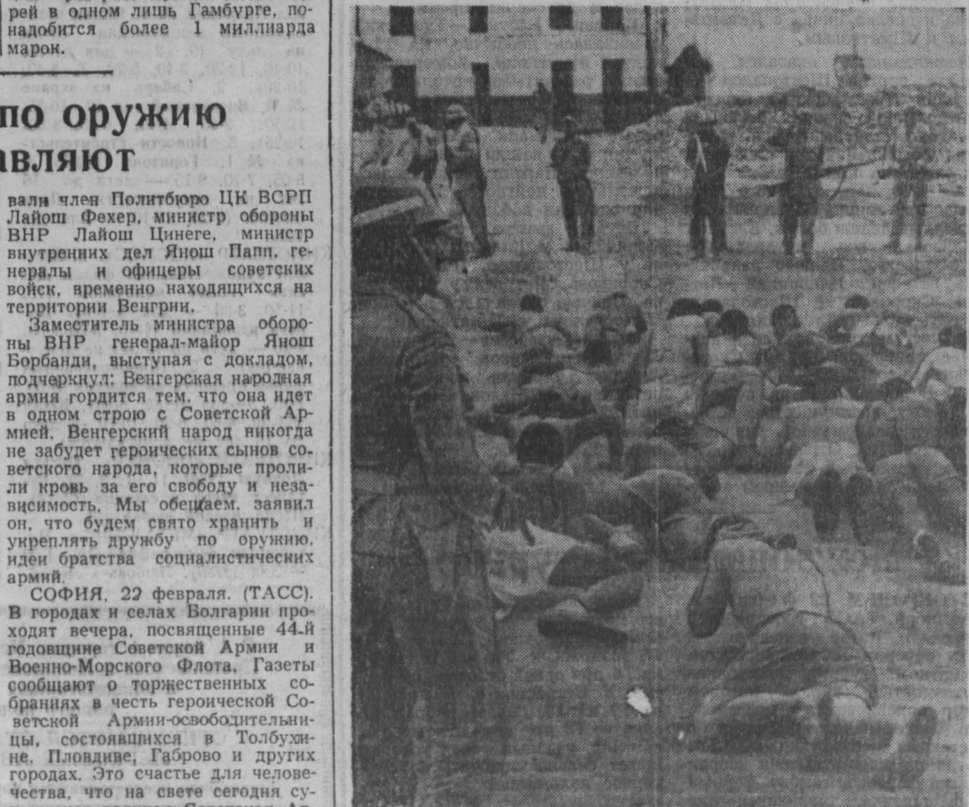
БРАЗИЛИЯ. В тюрьме Рио-де-Жанейро произошли волнения. Подводкой послужило плохое качество пищи. Как сообщает иностранное агентство, в атаке тюрьмы начался пожар, затем заключенные стали разбивать все, что попадало им в руки. Была вызвана военная полиция. По поступившим в печать сведениям, 5 человек убито и 35 тяжело ранено. НА СНИМКЕ: после подавления волнений во дворе тюрьмы.

ВАРШАВА, 22 февраля. (ТАСС). Третий день в Польше продолжается декада, посвященная празднованию 44-й годовщины Советской Армии и Военно-Морского Флота. По случаю праздника в воинских подразделениях польской армии проходят торжественные заседания, концерты, встречи с ветеранами Войска Польского, сражавшихся плечом к плечу с советскими воинами. На промышленных предприятиях, в клубах Общества польско-советской дружбы организованы выставки и фототворчество, отражающие историю Советских Вооруженных Сил, польско-советское братство по оружию. Многолюдно все эти дни в залах Дома Войска Польского. Сюда приходят посмотреть две выставки: «Советская книга в польском переводе», «Советская Армия в искусстве». Большой интерес у посетителей вызывает выставка «Советская Армия в искусстве». Эта выставка организована с помощью Центрального Дома Советской Армии в Москве. Среди нескольких десятков работ, находящихся на выставке, представлены полотна Грехова «Знаменщик и труба», Сегала «Первые декреты Советской власти» и другие. БУДАПЕШТ, 22 февраля. (ТАСС). Торжественное собрание, посвященное 44-й годовщине Советской Армии, состоялось в Будапеште. На нем присутство-