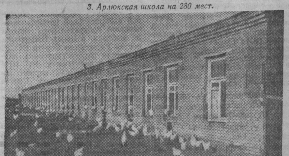
4. Птичник на 20 тыс. кур.