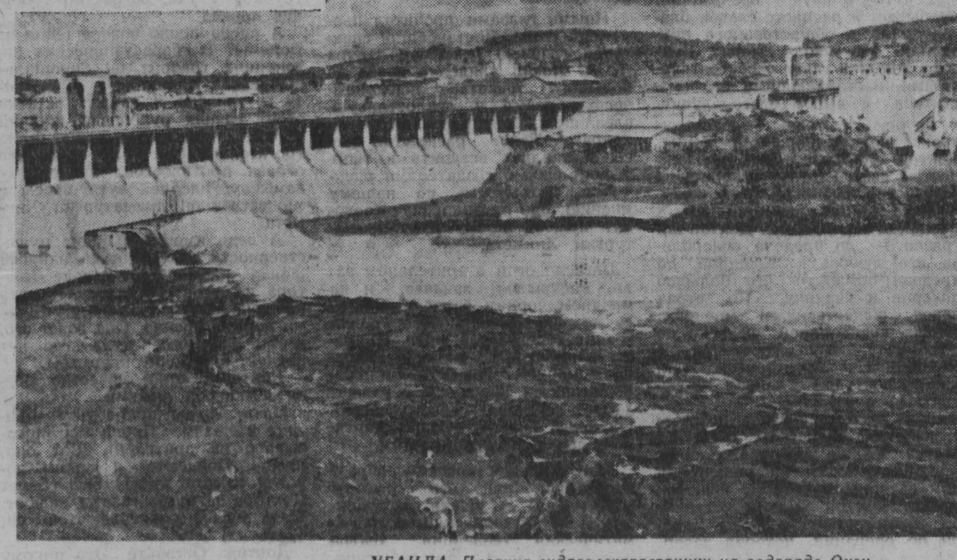
УГАНДА. Плотины гидроэлектростанции на водопаде Оуз.