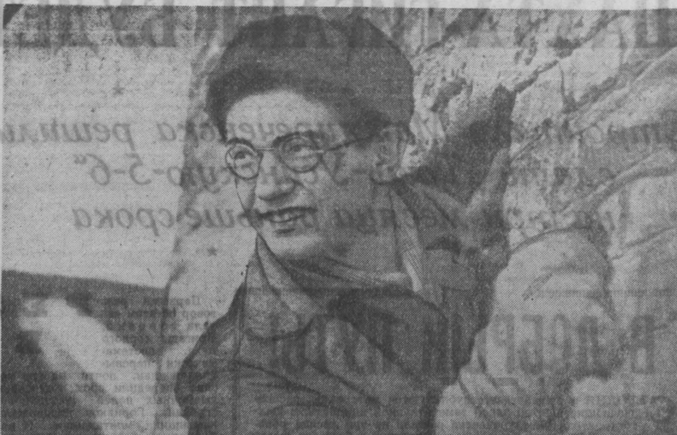
А. БАШЕВСКО-Байдавская центральная обогатительная фабрика — одна из ударных строек Кузбасса. В эти дни здесь идут работы к концу, и строители делают все для того, чтобы скорее и качественнее сдать объекты для опробования, а потом и в эксплуатацию.

Провалил план комбинатов добычи, здесь валял курс на