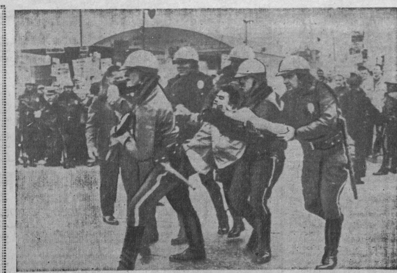
Соединенные Штаты Америки. В Калифорнии на предприятии «Локхид» изобрет корпорации состоялась забастовка, в ней приняло участие десять тысяч рабочих. Трудящиеся требуют повышения заработной платы, улучшения условий труда и признания права профсоюзов.

В начале выступления президент США подчеркнул, что Соединенные Штаты не намерены изменить свой внешнеполитический курс, который, по его словам, определяется интересами их безопасности. Однако, отметил Кен-