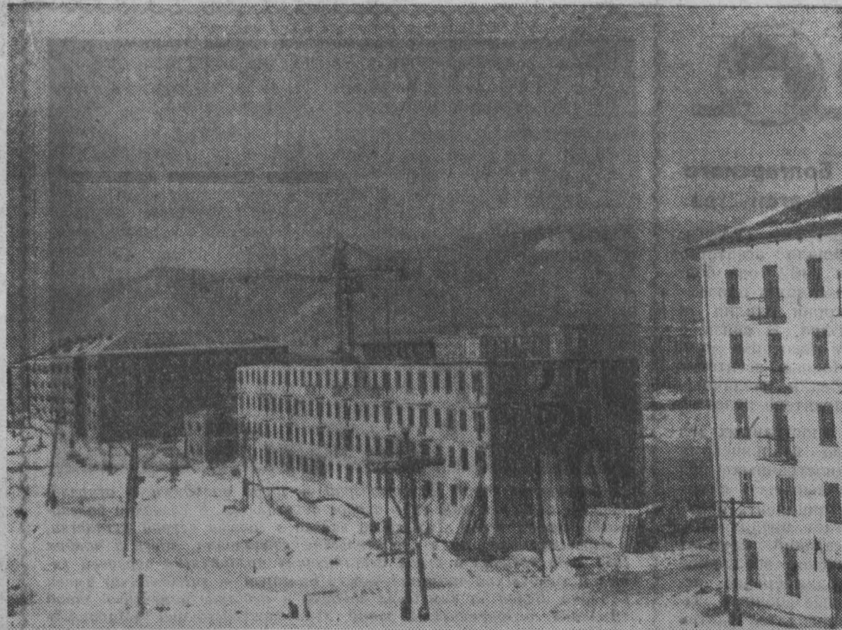
На этом месте еще в прошлом году был большой пустырь. А сейчас здесь, в 27-м квартале, работают строители. В четвертом году семилетки в Междуреченске будет сдано 50 тысяч квадратных метров жилья. Это примерно около 2.000 квартир. И самым «урожайным» будет в 1962 году 27-й квартал — 8 пятиэтажных домов примут новоселов до осени.