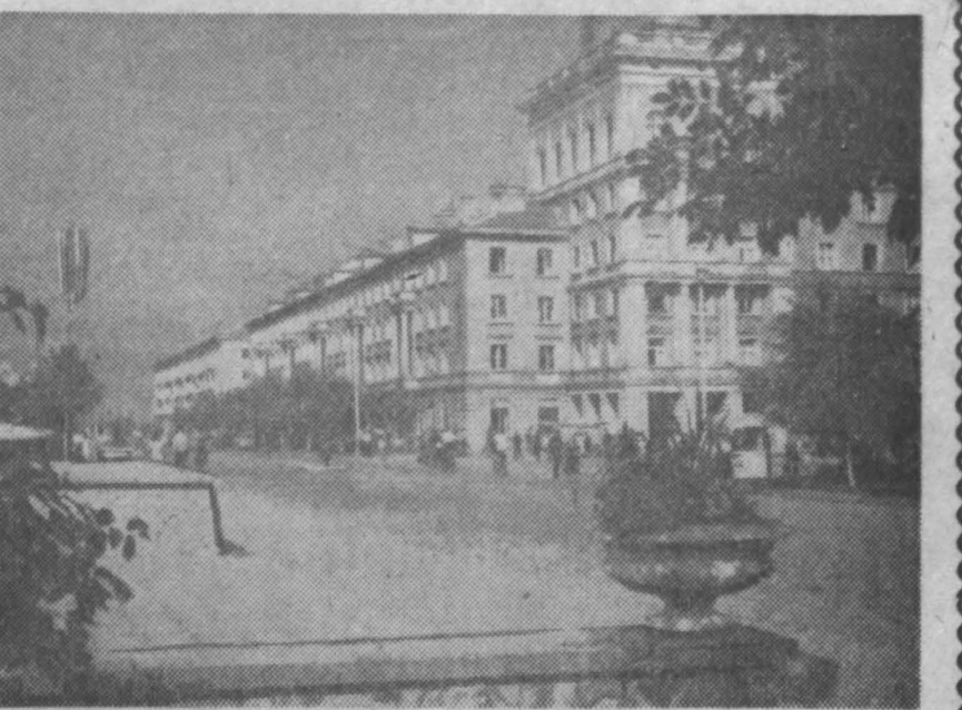
Болгарский город Димитровград — город молодежи — отпраздновал в прошлом году свое первое десятилетие. В ознаменование победы в строительстве социализма, здесь 5 ноября 1951 года вступила в строй действующих предприятий первая в тяжелой химической промышленности Болгарии — химкомбинат имени Сталина. Вслед за ним были введены в действие цементный завод «Вулкан», асбестовый завод, теплоэлектростанция «Маршала» и «Маршала» и другие промышленные объекты. Освобождая от лесов обширные территории, молодые строители города с гордостью объявляли: «первое в стране», «крупнейшее в стране».

Незаводо до закрытия конференции в Лагос прибыл премьер Республики Конго Сирил Адула, выступления которого послужили основой решений, относящихся к