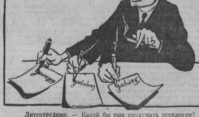
Литсотрудник: — Какой бы еще придумать псевдоним?