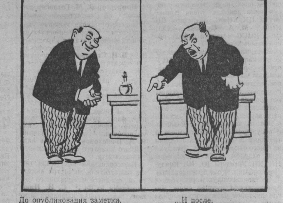
До опубликования заметки. ...И после.