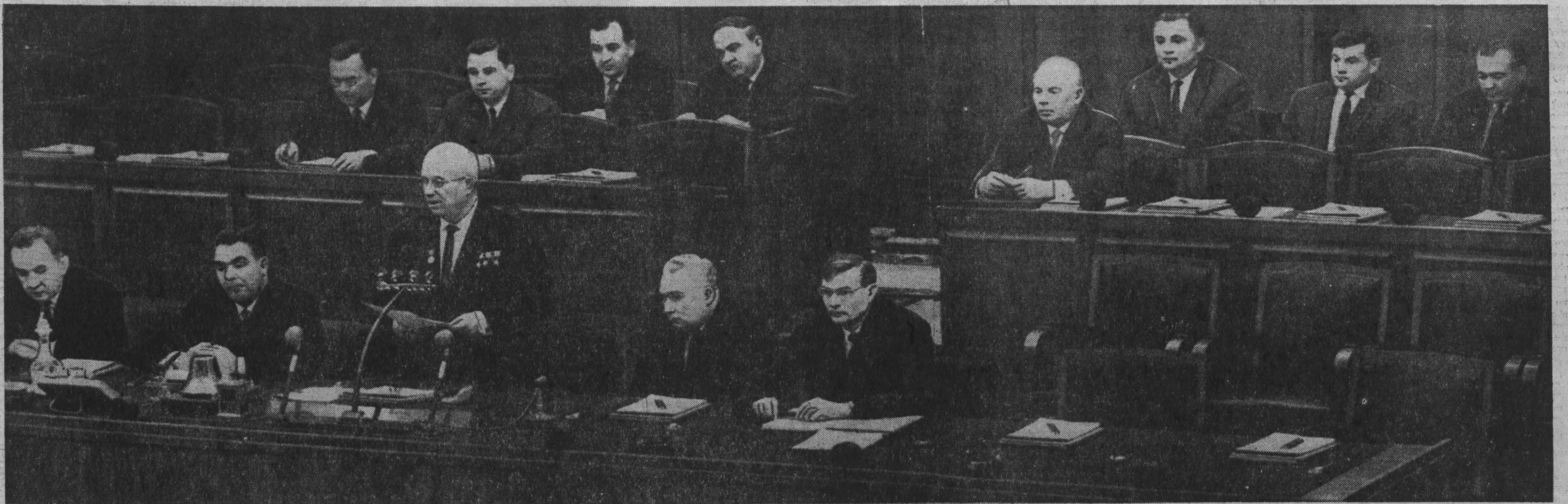
НА СНИМКЕ: в президиуме Пленума.

Как уже сообщалось, на вечернем заседании Пленума ЦК КПСС 20 ноября с речью выступил первый секретарь ЦК КП Узбекистана Ш. Р. Рашидов. Великий Ленин указывал, заявил он, что в социалистическом, коммунистическом строительстве нам приходится идти неизведанными путями и что нужно искать и находить на разных этапах строительства новые, гибкие формы управления народным хозяйством. В полном соответствии с этими ленинскими указаниями в докладе товарища Н. С. Хрущева определены меры, обеспечивающие дальнейшее коренное улучшение партийного руководства промышленностью, строительством и сельским хозяйством.