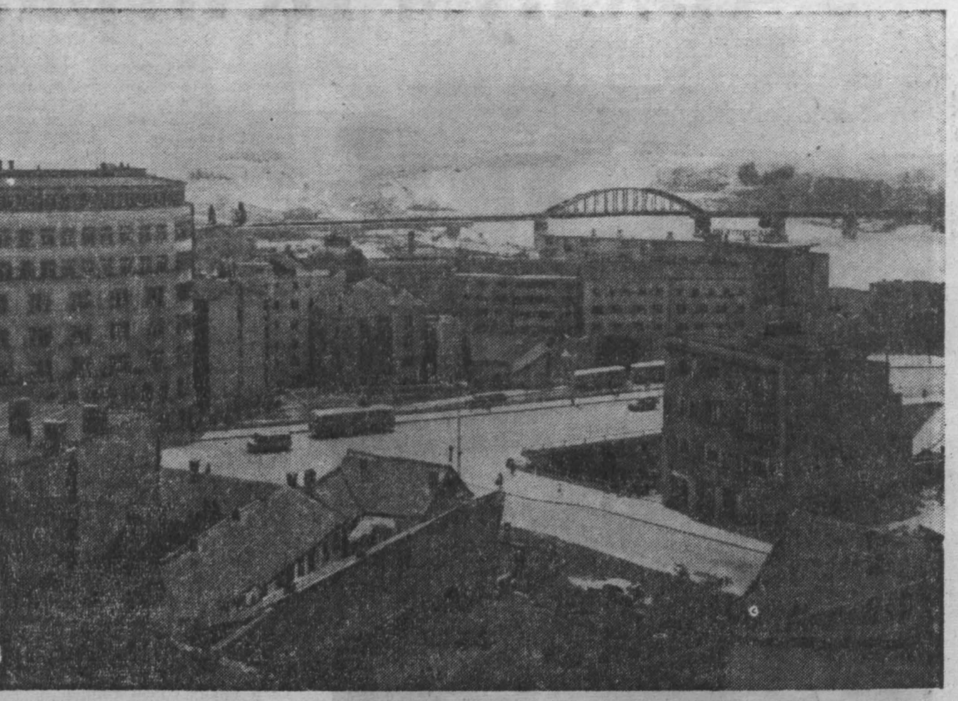
29 ноября — национальный праздник югославского народа. В 1945 году в этот день провозглашена Федеративная Народная Республика Югославия.

Для развития туризма в области президиум Кемеровского облпрофсовета решил создать в пять городов Кузбасса клубы туристов. Они организованы в Анжеро-Судженске при ДК шахты № 9-15, в Кемерове при ДК шахтеров, в Мариинске при спортзале ДСО «Спартак», в Прокопьевске при Дворце спорта и в Новокузнецке при ДК металлургов.