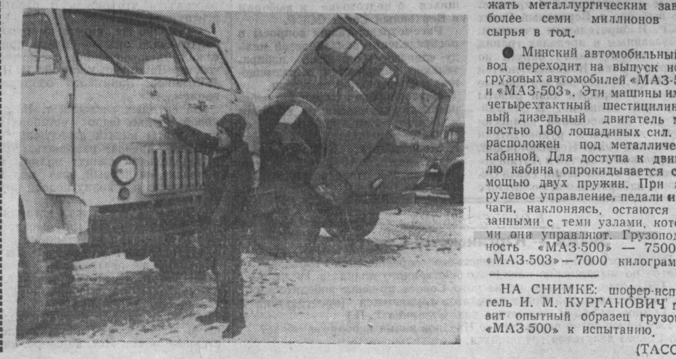
Минский автомобильный завод переходит на выпуск новых грузовых автомобилей «МАЗ-500» и «МАЗ-503». Эти машины имеют четырехтактный шестидесятилитровый дизельный двигатель мощностью 180 лошадиных сил. Он расположен под металлической кабиной. Для доступа к двигателю кабина опирается с помощью двух пружин. При этом рулевое управление, педаль и рычаги, наклоняясь, остаются связанными с теми узлами, которыми она управляет. Грузоподъемность «МАЗ-500» — 7500, а «МАЗ-503» — 7000 килограммов.

Г. МАСЛИН, секретарь парторганизации шахты № 7 треста «Киселевскуголь».