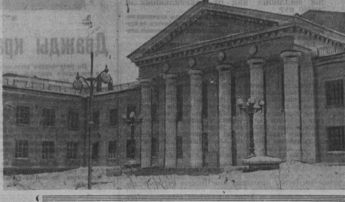
НА СНИМКЕ: прокопьевский Дворец спорта.