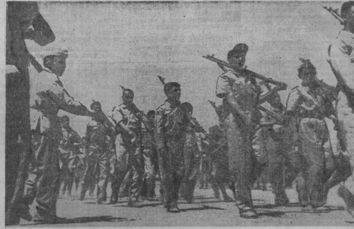
ПО ТУ СТОРОНУ