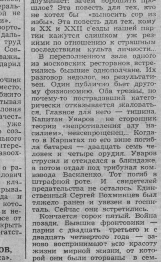
В. БАННИКОВ, спец. корр. «Кузбасс».