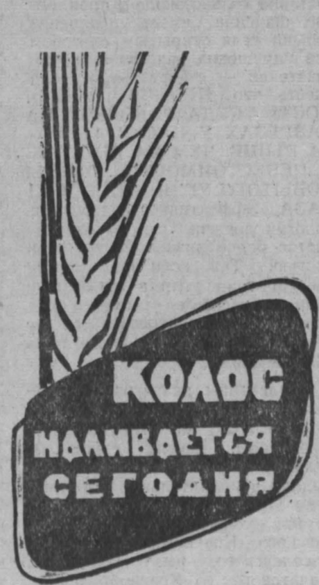
КОЛОС НАБИВАЕТСЯ СЕГОДНЯ

История эта заслуживает подробного изложения. Тем более, что райком партии принадлежит в ней не последняя роль. Дело вот в чем. Перед поездкой в колхоз тов. Матросова мы зашли в райком партии. Нам сказали, что колхоз прекратил вывозку перегноя по согласованию с районным комитетом: колхозники заго-