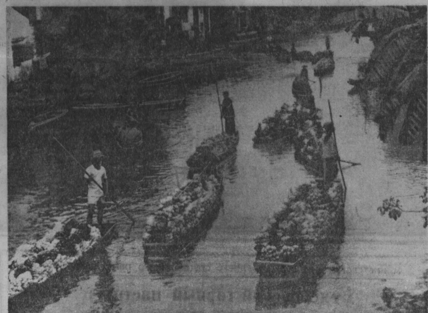
КИТАЙСКАЯ НАРОДНАЯ РЕСПУБЛИКА. Доставка овощей в город в уезде Чжуньюань провинции Гуандун.

НЬЮ-ЙОРК, 27 января. (ТАСС). К утру сегодняшнего дня делегация США на совещании в Пунта-дель-Эсте все еще не удалось собрать необходимого большинства для одобрения своей программы санкций против Кубы. Надежды на принятие этой программы, которую корреспондент «Нью-Йорк геральд трибюн» называет «разбавленной», «слабыми уликами» в результате сопротивления делегаций крупнейших латиноамериканских стран. Продолжавшиесь весь вчерашний день секретные переговоры Раска с основными делегациями, выступившими против его плана, успеха не принесли. Как передает корреспондент агентства АП, про-