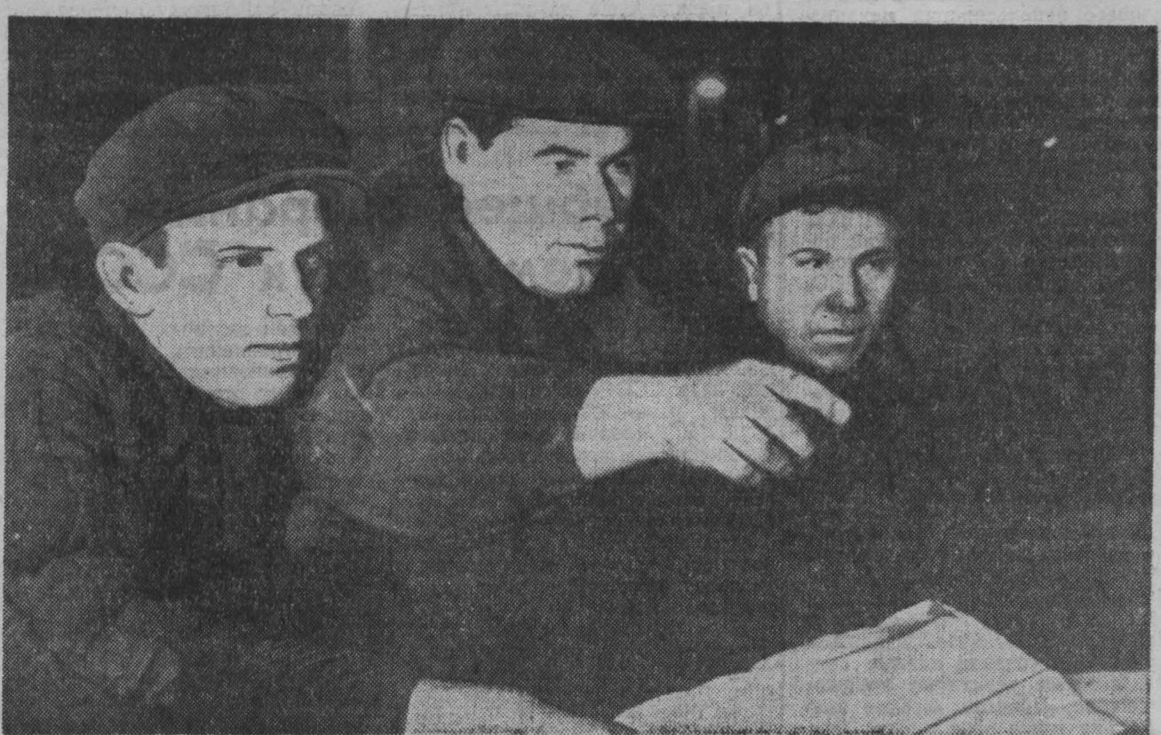
Новокузнецкий завод металлоконструкций изготавливает каркас для первой дома Западно-Сибирского металлургического завода.

Склад готовой продукции каскетного производства разгружен, исправляются его конструкции. Отремонтированы кассеты, сделаны асфальтовые полы в главном корпусе.