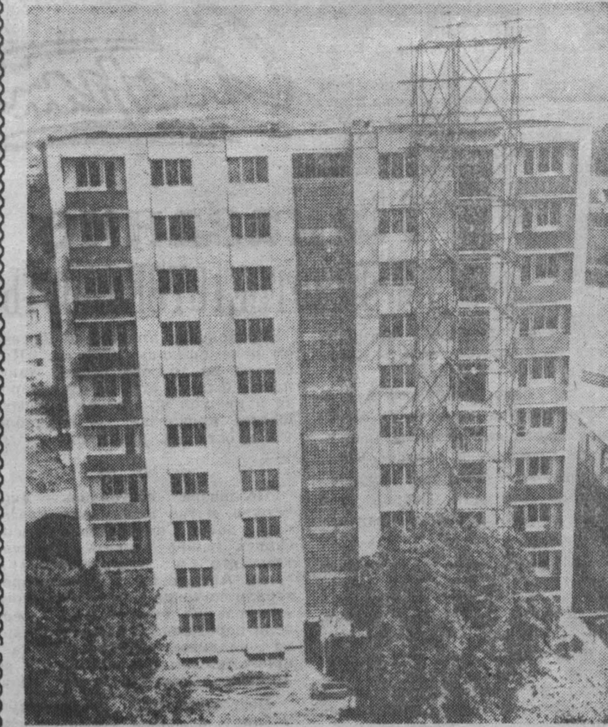
В ГОРОДАХ Чехословакии Социалистической Республики развернулось жилищное строительство. В городе Млада-Болеслав, где находится завод выпускающий известные легковые автомобили «Шкода», приступил к сооружению типовых 10-этажных домов. В каждом здании 40 комфортабельных квартир, состоящих из трех комнат и кухни. На снимке: строительство десятиэтажного дома в Млада-Болеслав. Новоселье состоится в конце нынешнего года.

— Не забудьте, друг, что в конце сентября мне делать доклад на Всероссийском съезде хирургов. Таков он и есть всю жизнь. В. ОЛЕНЕВА.