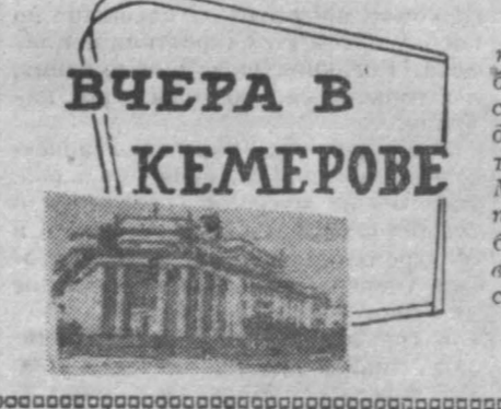
Вчера в Кемерове

Более 600 тонн картофеля собрано в Бураковском совхозе за последние дни. Почти весь он лежит под открытым небом. Овошкранительница подоготовлены для приема овощей. Например, в Севском отделении семенной картофель высыпается в неотомпированный подвал. Наверняка семена будут зайты осенними дождями и заморозками. Сейчас стоит сухая погода, а руководители совхоза не разрешают вывозить картофель с полей заготовителям ора треста «Киселевскуголь». В прошлом году в Бураках заморозили сотни центнеров клубней. Ныне эта история снова повторяется. (Корр. «Кузбасса»).