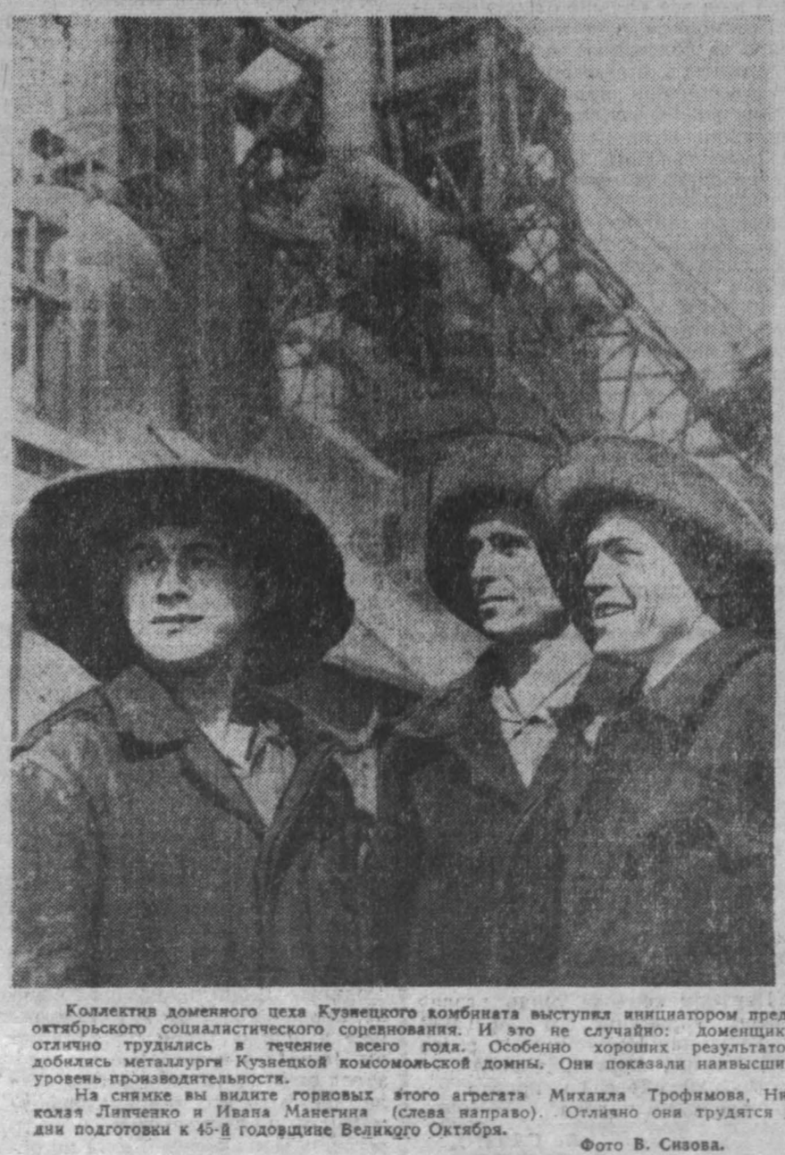
Коллектив доменного цеха Кузнецкого комбината выступил инициатором предоктябрьского социалистического соревнования. И это не случайно: доменщики отменно трудились в течение всего года. Особенно хороши результаты добился металлург Кузнецкой коксохимической домы. Они показали высочайший уровень производительности.

Участники ассамблеи обсуждают текущие вопросы деятельности федерации, задачи дальнейшей борьбы ученых за мир, прогресс, улучшение международного сотрудничества ученых на благо всего человечества.