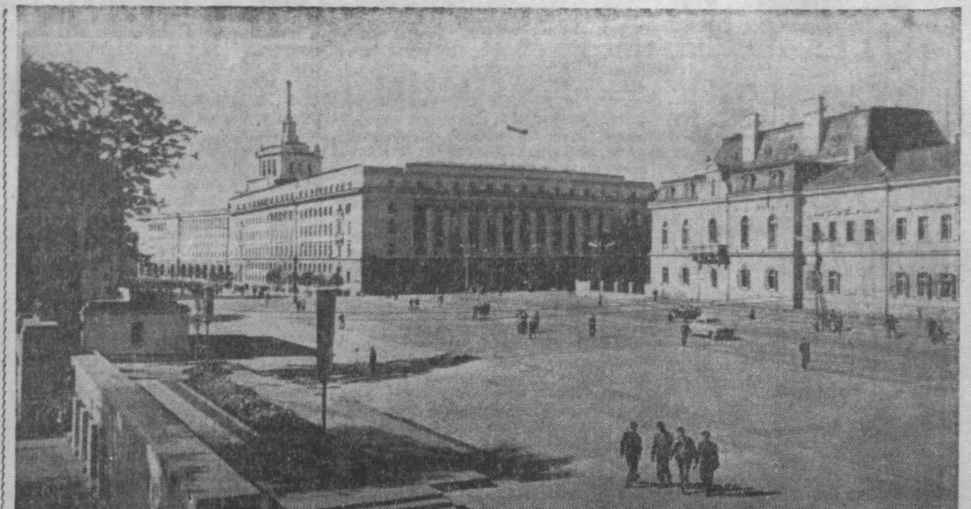
Завтра у болгарского народа большой национальный праздник — День Свободы. С 9 сентября 1944 года, когда народ пришел к власти, страна реально изменила свой облик.