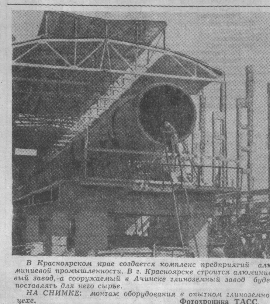
В Красноярском крае создается комплекс предприятий алюминевой промышленности. В г. Красноярске строится алюминевый завод, а сооружается в Ачинске глиноземный завод. Будет поставлена для него сырье.

«ПРО ВОДА ЗАВЫСНЫ УЗЕЛКОВИ» — так называлась заметка, опубликованная в «Кузбасса» 30 июня. Беловский горком КПСС сообщает, что недостелки, оставшиеся после сдачи шахты «Чертинская-Западная», в эксплуатацию, ликвидированы. Пролена кабельная связь между поселком и шахтой. Построена автоматическая станция на 200 номеров. В настоящее время ведутся наладочные работы. Первые 50 номеров будут включены в сентябре, а остальные — в октябре.