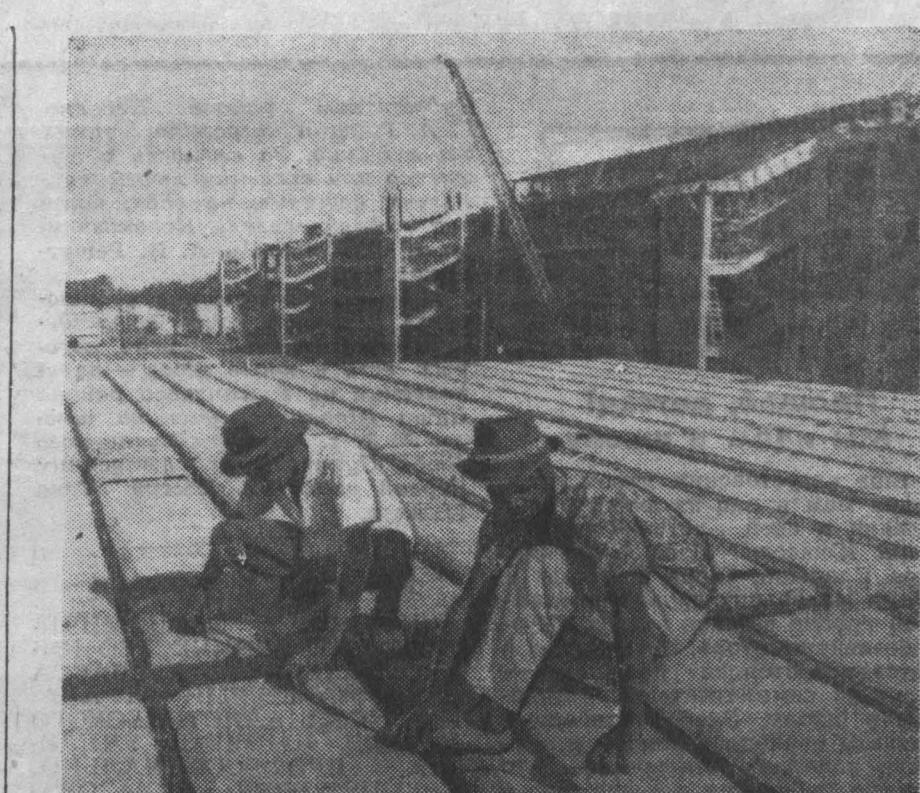
Гвинейская Республика. При помощи советских специалистов в Конакри строится политехнический институт на 1200 мест.