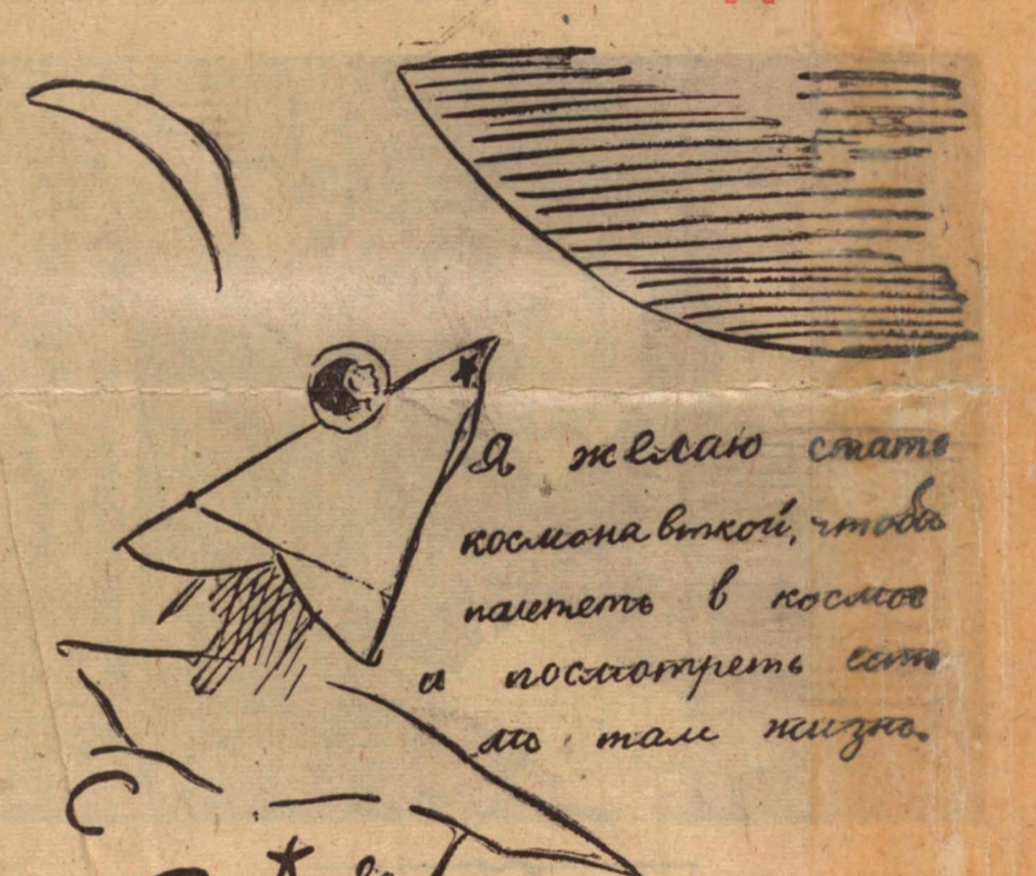
Рисунок Гали Туник, ученица 3-го класса.