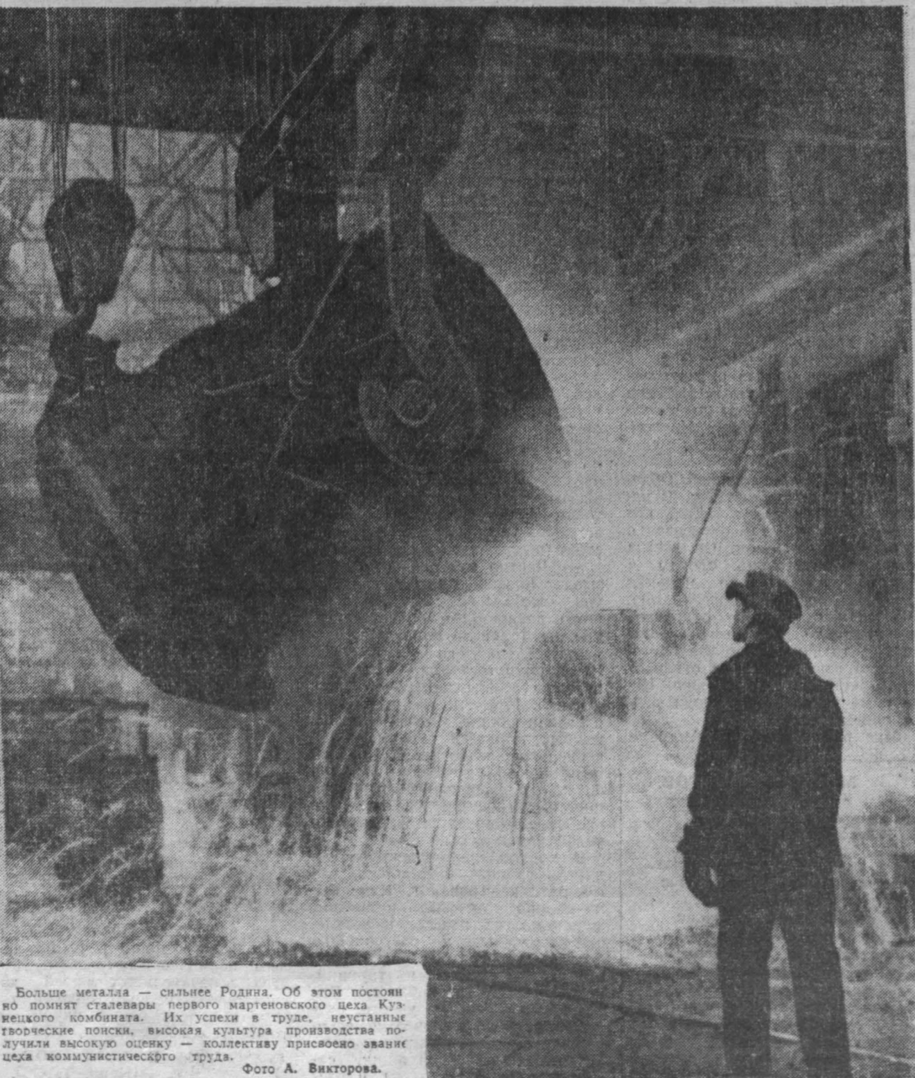
Больше металла — сильнее Родина. Об этом постоянно помнят сталевары первого мартеновского цеха Кузнецкого комбината. Их успехи в труде, неустанные творческие поиски, высокая культура производства получили высокую оценку — коллективу присвоено звание цеха коммунистического труда.

Аппаратура на кораблях «Восток-3» и «Восток-4» работает нормально.