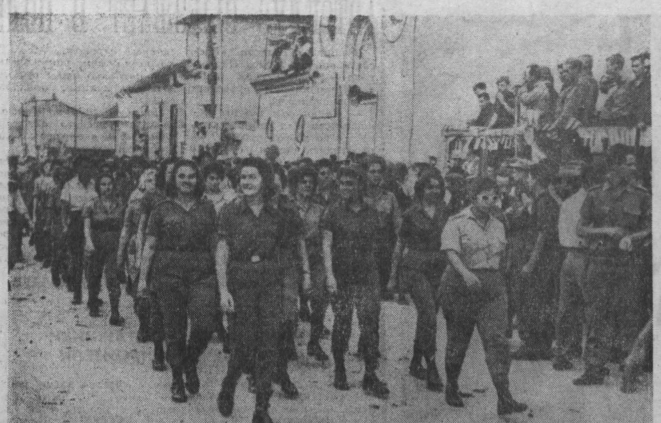
Республика Куба. На центральной площади города Карденаса (провинция Матанас) состоялась многотысячная демонстрация в ответ на провозглашение группой контрреволюционеров Демонстрация показала непреклонную волю народа защищать родину и революцию. На снимке: колонна женщин — участниц патриотической организации.