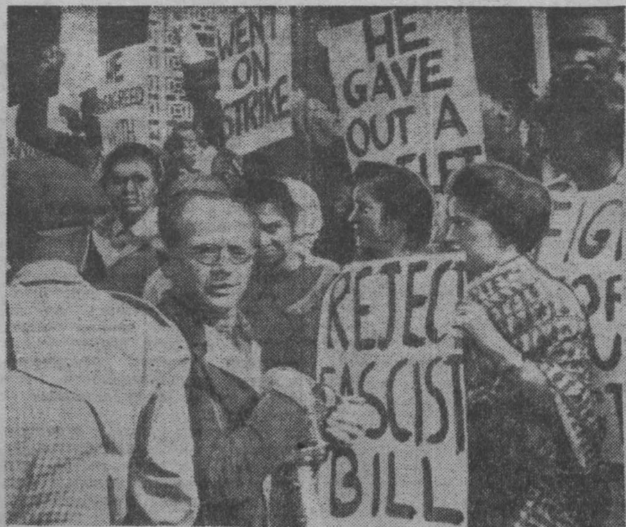
Южно-Африканская Республика. Правительство ЮАР приняло недавно фашистский закон о введении смертной казни за так называемый «саботаж», в понятие которого включается всякая критика правительства. На снимке: демонстранты в Йоханнесбурге. В их руках плакаты «Отменить фашистский закон!»

С. КУРАНЦЕВ, зав. организаторским отделом облисполкома.